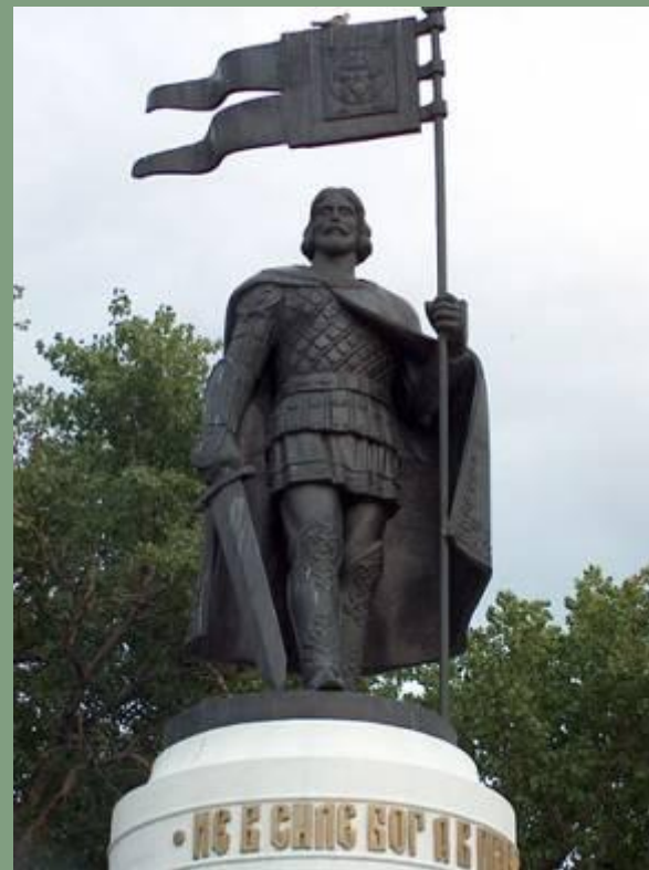
Памятник Александру Невскому в Курске.

Эти две победы очень важны для дальнейшего развития Руси. Северные и западные границы Руси были в безопасности.