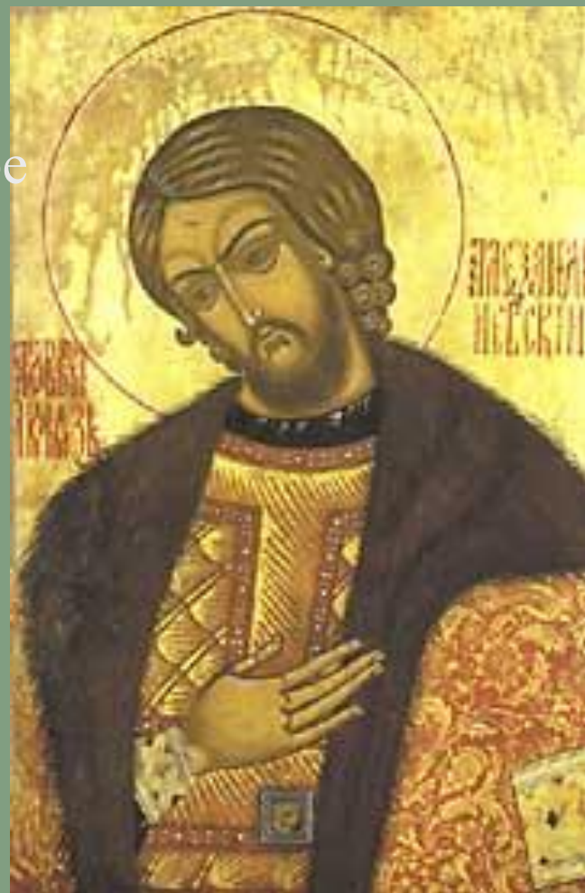
Икона святого благоверного князя Александра Невского