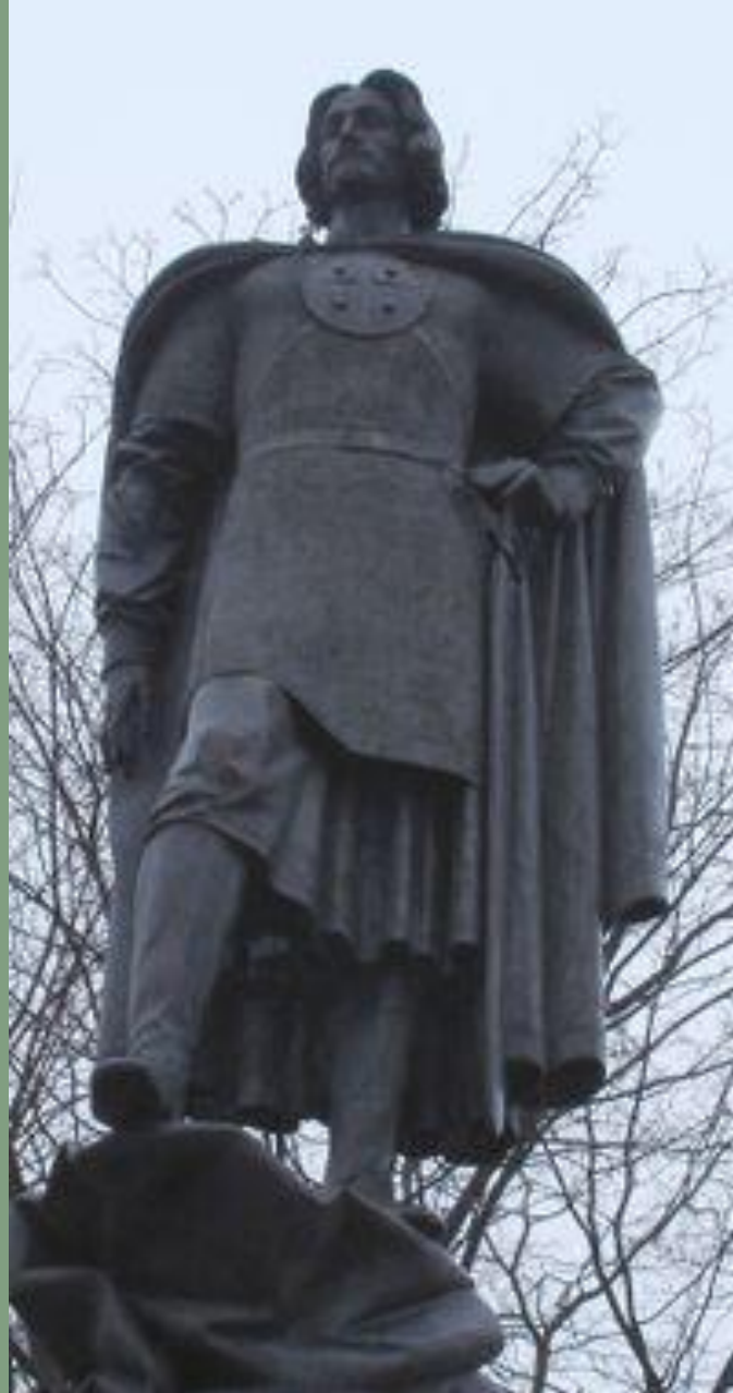
Памятник в Санкт-Петербурге (Усть-Ижора)