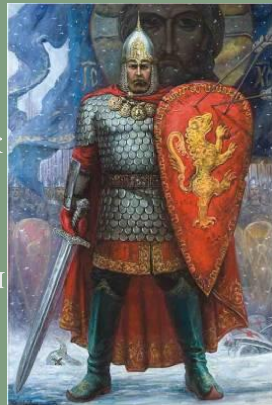
Александр Невский. Портретная галерея Патриархов Московских и всея Руси. Русь православная.

На восточных рубежах Руси нависли несметные полчища монголов. Александр Невский понимал, что не пришло ещё время сражаться с ними, так как у русского народа не было достаточно сил, чтобы победить их. И он выбрал путь дипломатии, переговоров и вынужденного признания силы победителей. Это не было трусостью и предательством. Он являлся передовым человеком своего времени и понимал, надо терпеть, чтобы сохранить Русь.