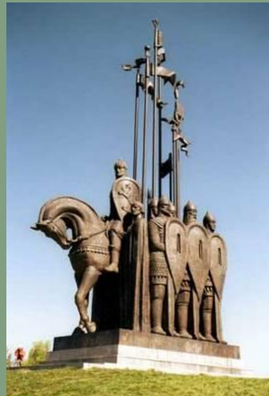
Памятник Александру Невскому в Пскове

Вначале Александр Невский был похоронен в монастыре во Владимире.