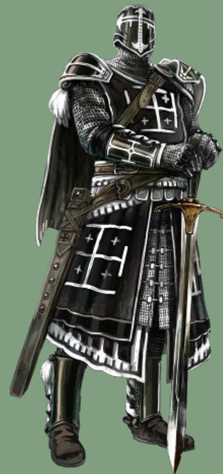
Рыцарь-крестоносец с оружием и в доспехах