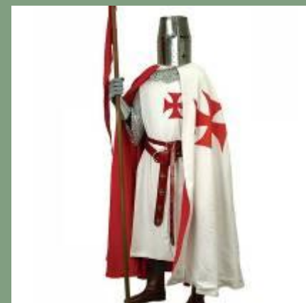
Рыцари-крестоносцы с оружием и в доспехах