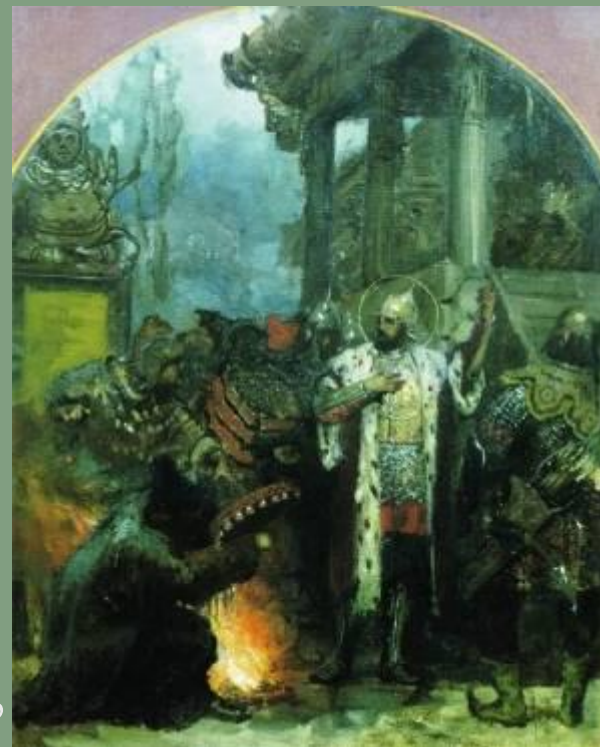
Александр Невский в Орде. 1876 - Г.И. Семирадский.

В 1262 г. Такие волнения вспыхнули в землях Ростова, Суздаля, Владимира, Переяславля и многих других. Народ выгонял и даже убивал сборщиков податей. Разгневанный хан снова готовился отомстить русским и собирал отряды для усмирения. Александр Невский отправился в Орду, привёз с собою дары для хана и снова уговорил его не разорять русские города.