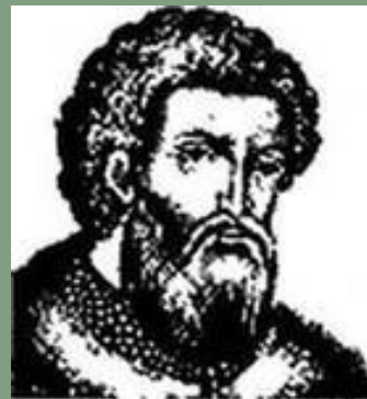
Ярослав II Всеволодович – отец Александра

Так случилось и с отцом Александра, князем Ярославом. Новгородцы несколько раз приглашали его к себе и также часто прогоняли его из-за крутого нрава. Свидетелем таких повторяющихся ссор и примирений стал и молодой князь Александр, отрочество и юность которого проходили в Новгороде, и он вынужден был с отцом и братом то покидать его, то возвращаться снова.