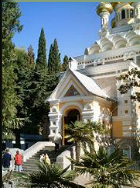
Храм Александра Невского в Ялте