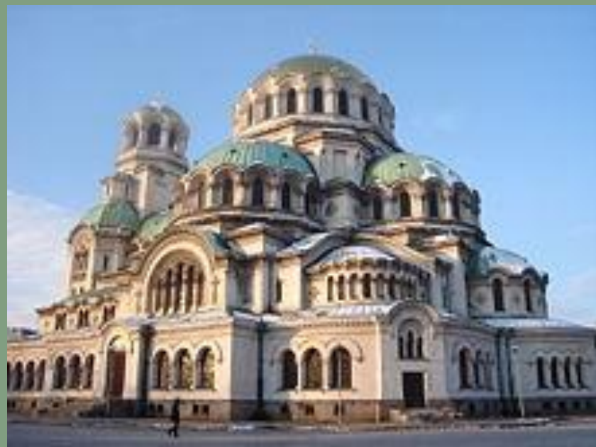
Храм Александра Невского в Софии