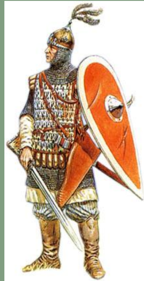
Русский воин с оружием и в доспехах