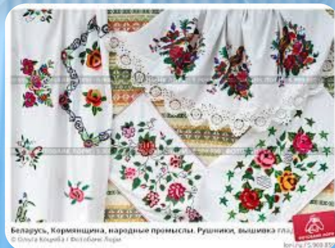
Беларусь, Кормишчина, народные промыслы. Рушники, вышивка глина. © Ольга Клепач / Фото: Борис Лурка