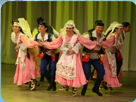
Калфак – татарский женский головной убор

Штаны татарского костюма, если судить по крою, представляли собой поясную одежду, характерную для тюркоязычных народов. Ее называют штанами с широким шагом. Полосатая ткань использовалась для пошива мужских брюк татарского костюма.