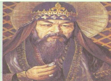
Жәнібек хан. Суретші Ә.Бұхарбаев

Орыс ханның шебересі Барақ ханның ұлы Жәнібек