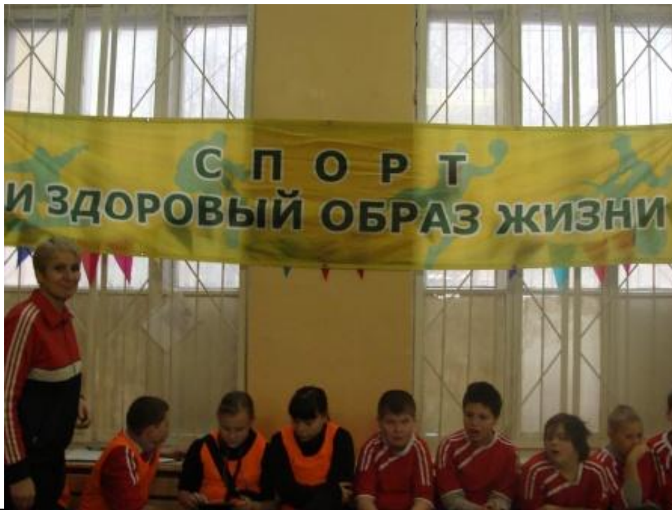
Папа, мама, я-спортивная семья