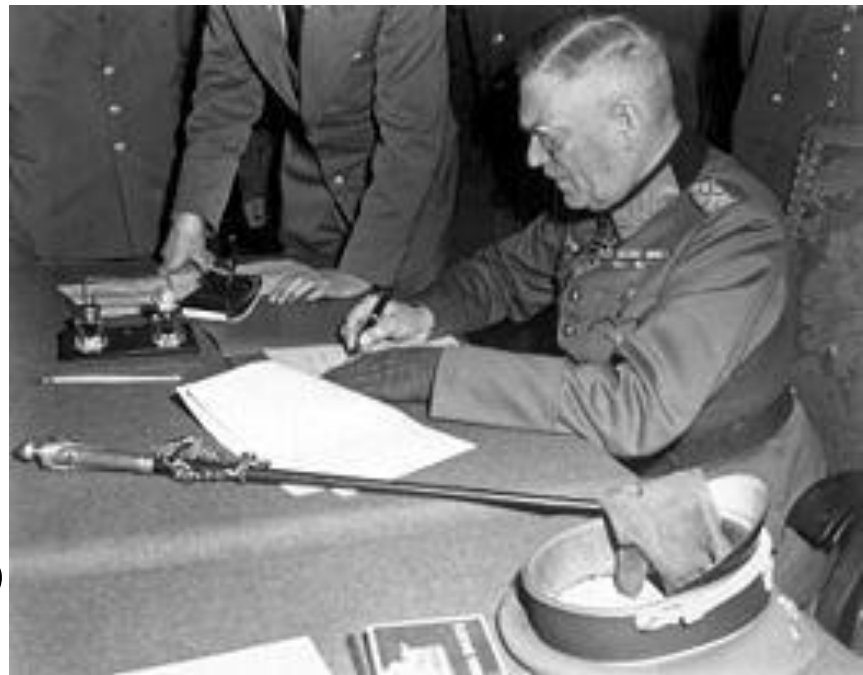
Вильгельм Кейтель подписывает Акт о безоговорочной капитуляции Германии

9 мая в 0:43 по московскому времени генерал-фельдмаршал Вильгельм Кейтель, а также представитель люфтваффе генерал-полковник Штумпф и Кригсмарине адмирал фон Фридебург, имевшие соответствующие полномочия от Дёница, подписали ещё один Акт о безоговорочной капитуляции Германии, который вступил в силу 9 мая с 00:00 по московскому времени.