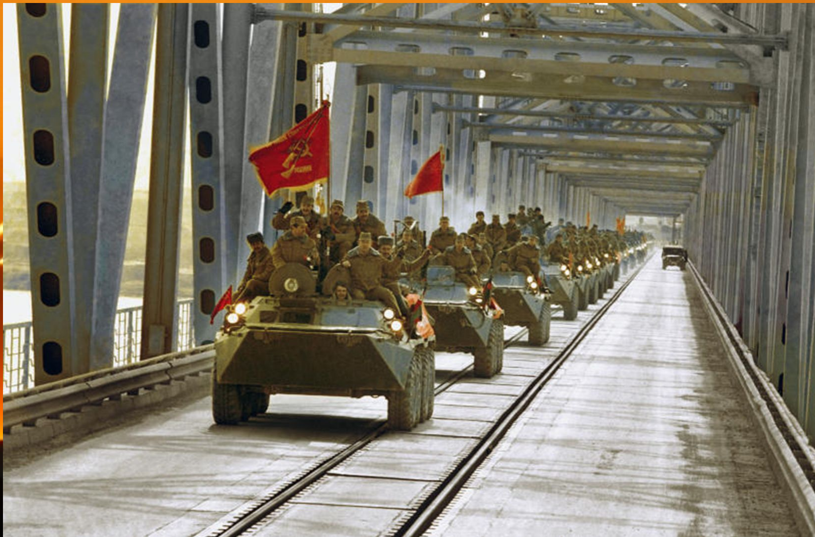
Вывод советских войск из Афганистана 15 февраля 1989 года