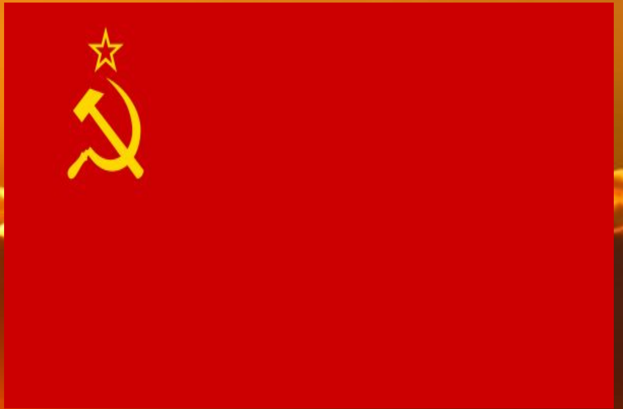
Флаг Советского Союза