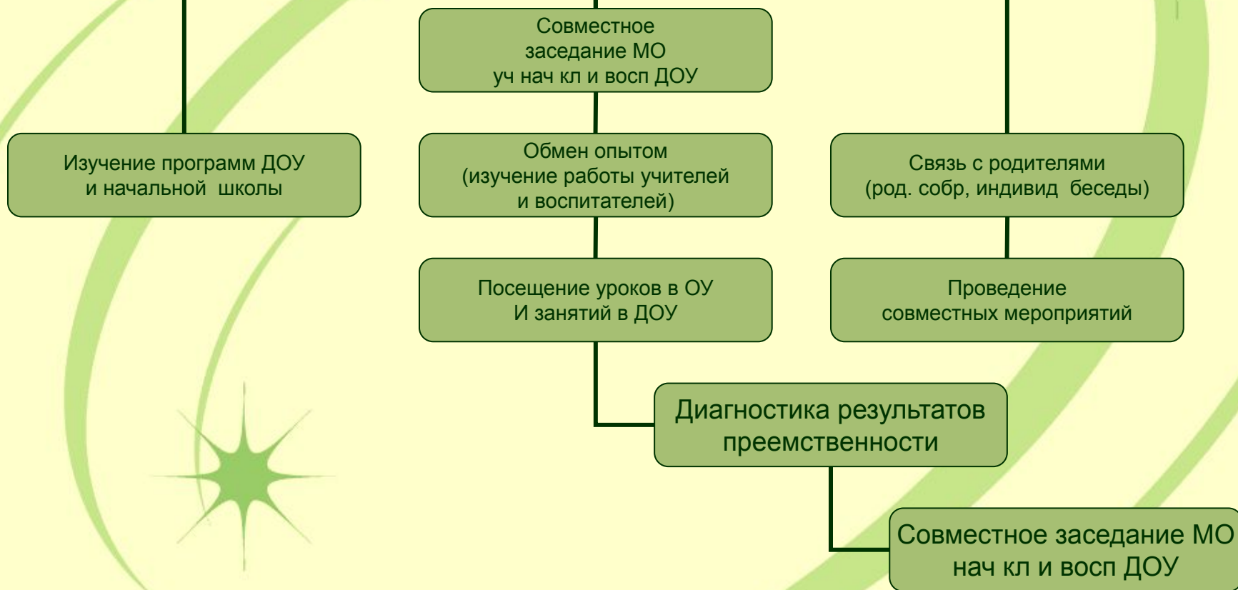
Схема сотрудничества МОБУ СОШ с. Нурлино и МДОБУ детский сад «Аленький цветочек»