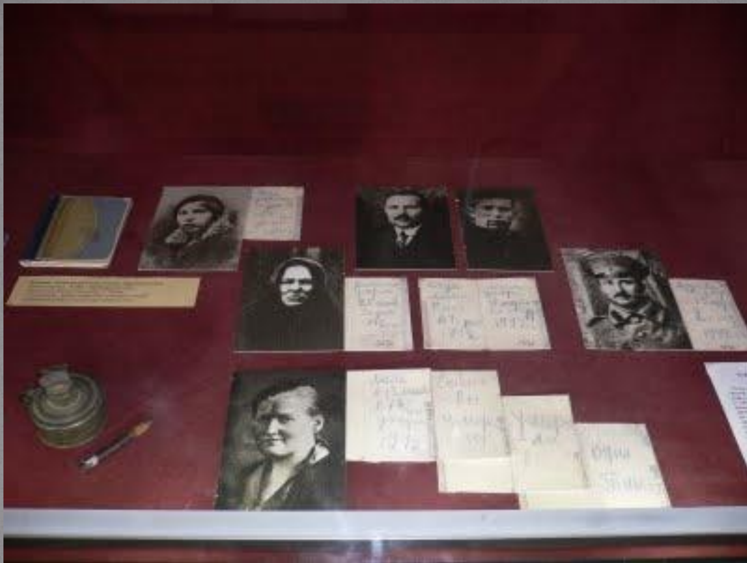
Дневник Тани Савичевой выставлен в Музее истории Ленинграда..