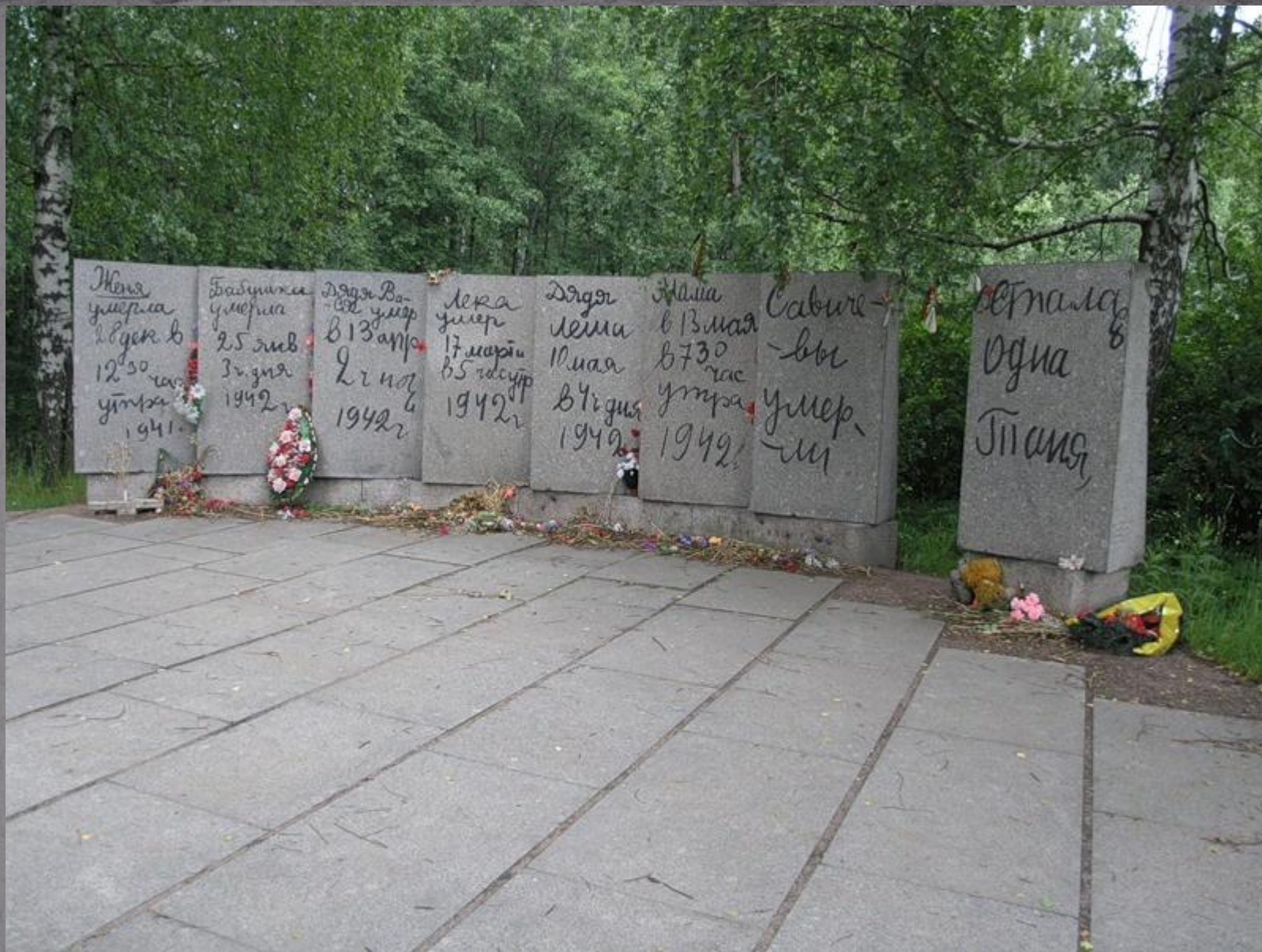
Дневник Тани Савичевой, в память о блокаде Ленинграда.