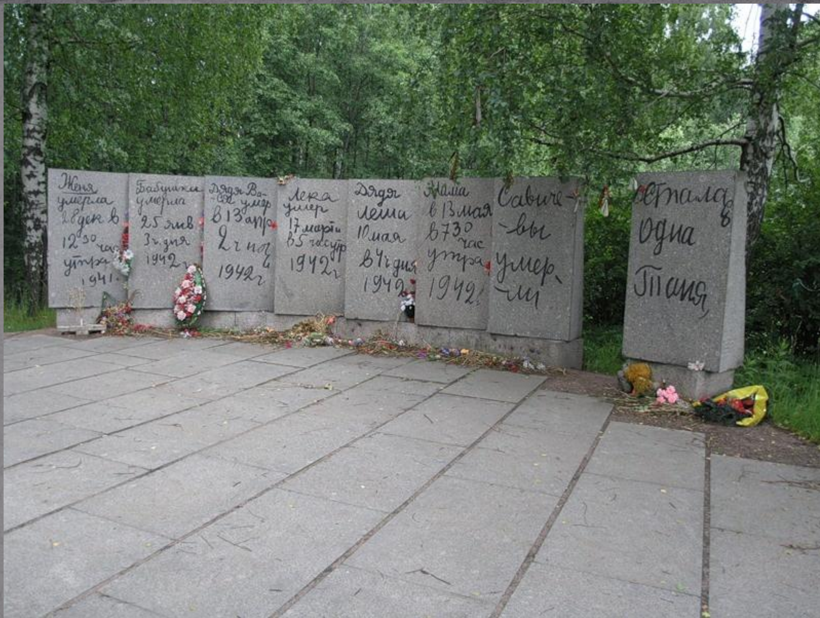
Дневник Тани Савичевой, в память о блокаде Ленинграда.