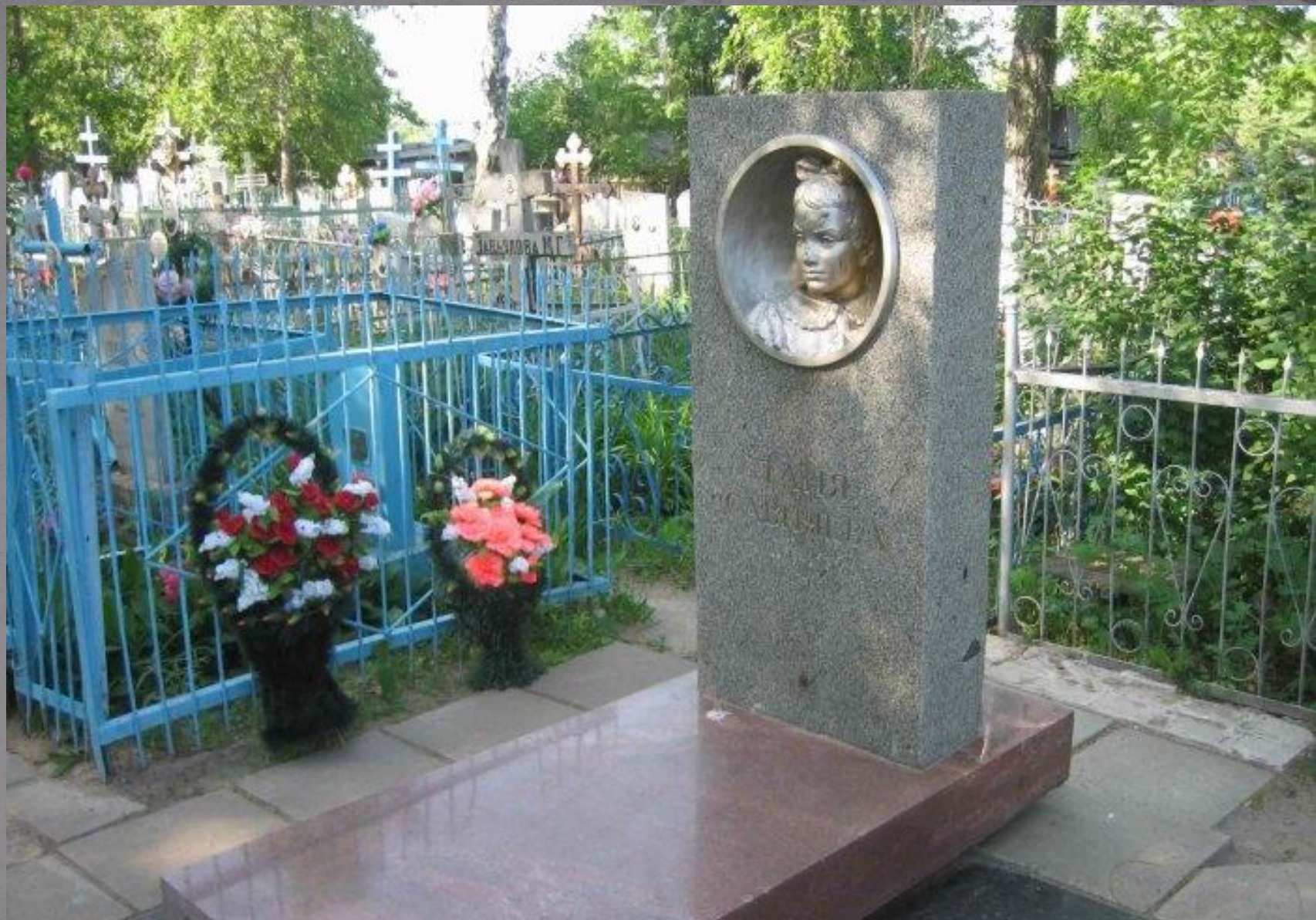
Шатки, Могила Тани Савичевой.