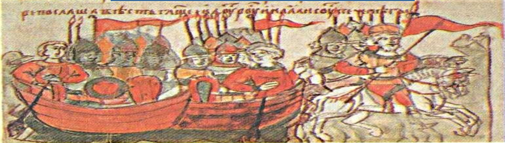
Поход князя с дружиной на ладьях и на конях. Миниатюра из летописи

2. ЦЕНТРАЛИЗАЦИЯ СИСТЕМЫ УПРАВЛЕНИЯ – В НАИБОЛЕЕ ВАЖНЫЕ ЗЕМЛИ НАПРАВИЛ В КАЧЕСТВЕ НАМЕСТНИКОВ СВОИХ СЫНОВЕЙ.