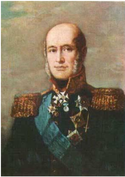
Михаил Барклай де Толли