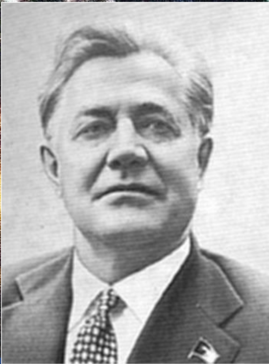
Слова - Алексей Александрович Сурков (1899—1983)