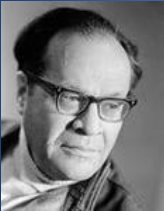
поэт Михаил Львович Матусовский (1915 — 1990)

композитор Вениамин Ефимович Баснер (1925 — 1996)