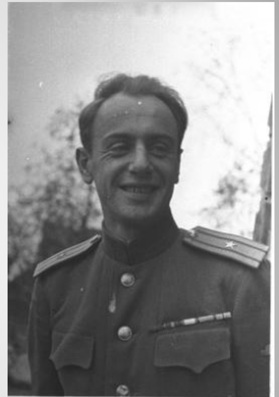
Поэт Евгений Долматовский

Песня еще одной неразрывной связью скрепила фронт и тыл.