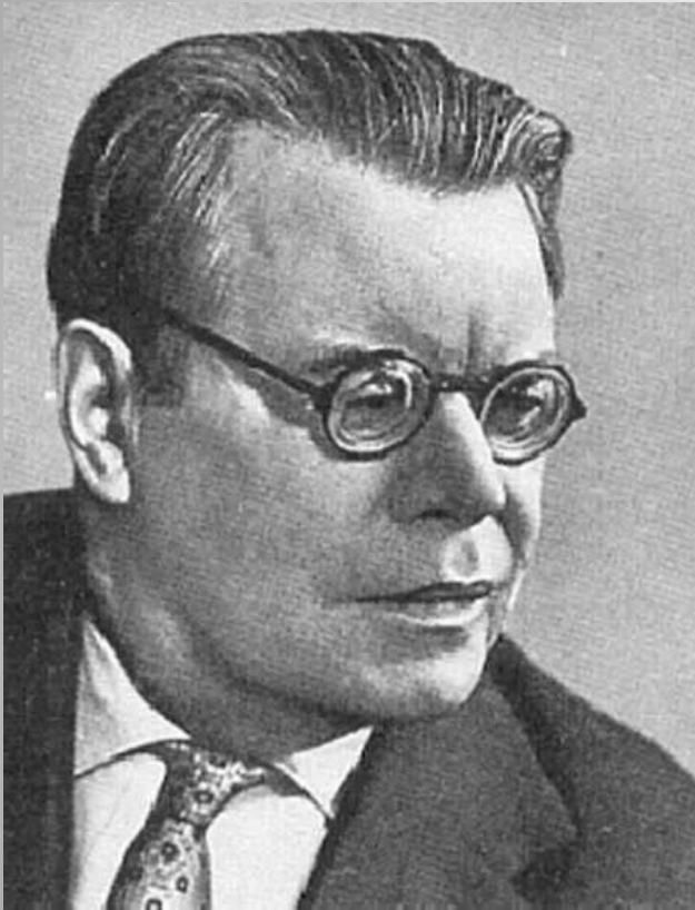
Михаил Исаковский 1900-1973г.г.

Большое место в его творчестве занимают патриотические стихи о Великой Отечественной войне 1941—45, о героизме советских людей на фронте и в тылу. Многие стихи, положенные на музыку, стали популярными народными песнями, они поются во всём мире: