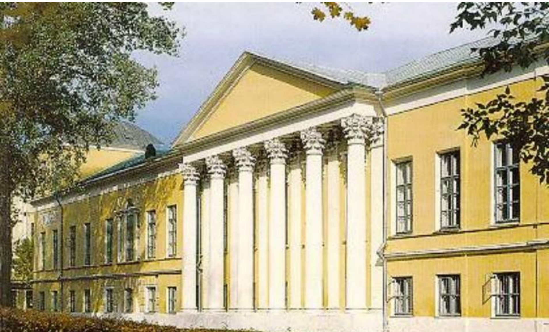
Рязанский государственный областной художественный музей им. И.П.