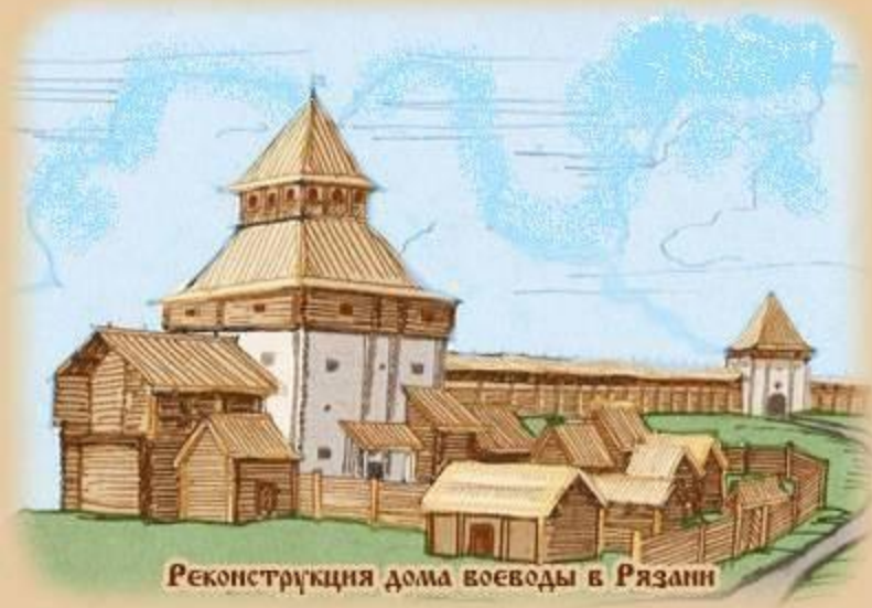
Реконструкция дома воеводы в Рязани

В каждом русском городе был правитель – князь или его наместник – посадник , которого он «сажал» вместо себя.