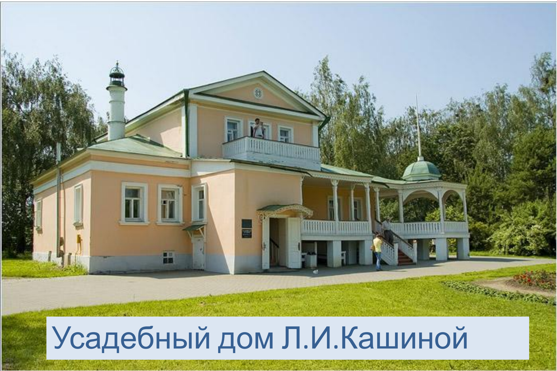
Усадебный дом Л.И.Кашиной