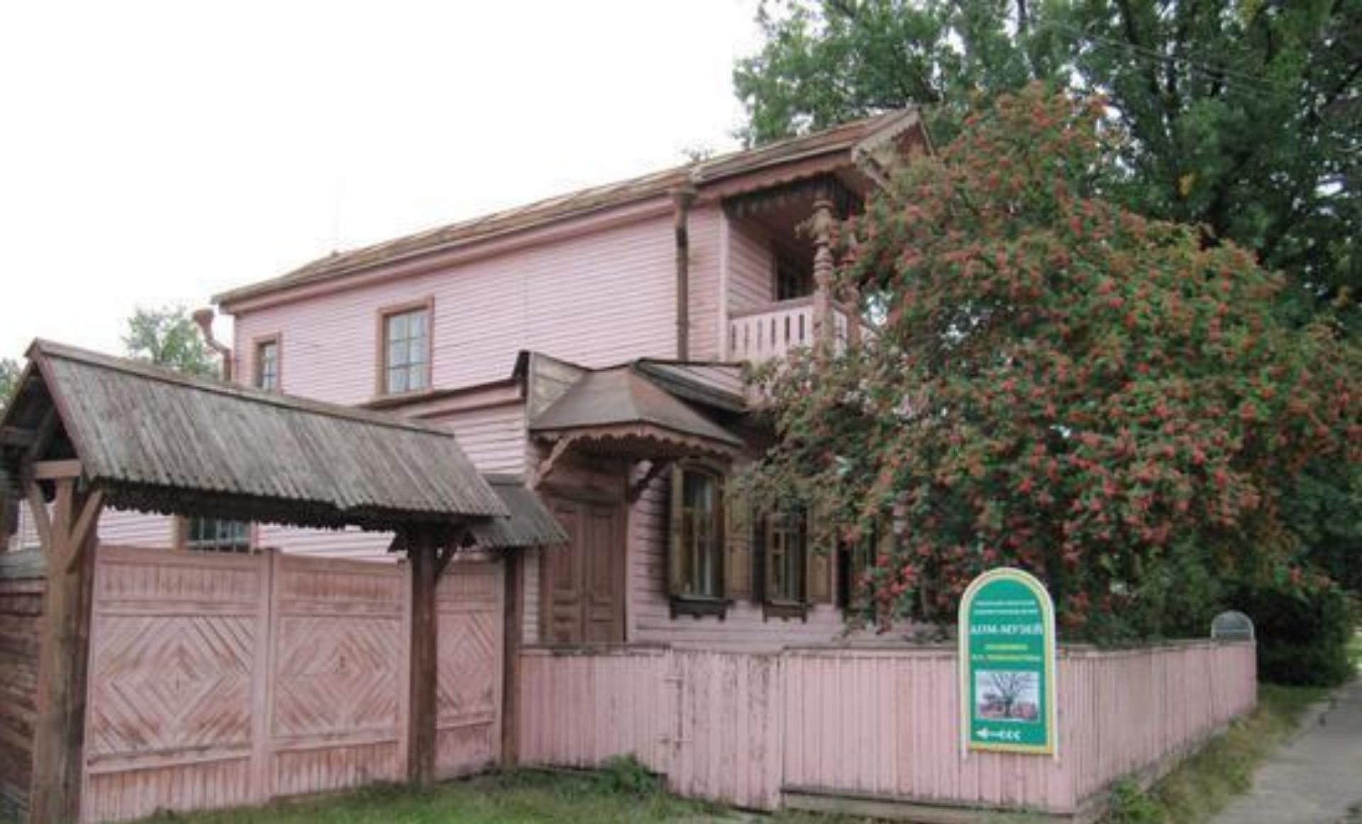
Мемориальный дом-музей И.П. Пожалостина