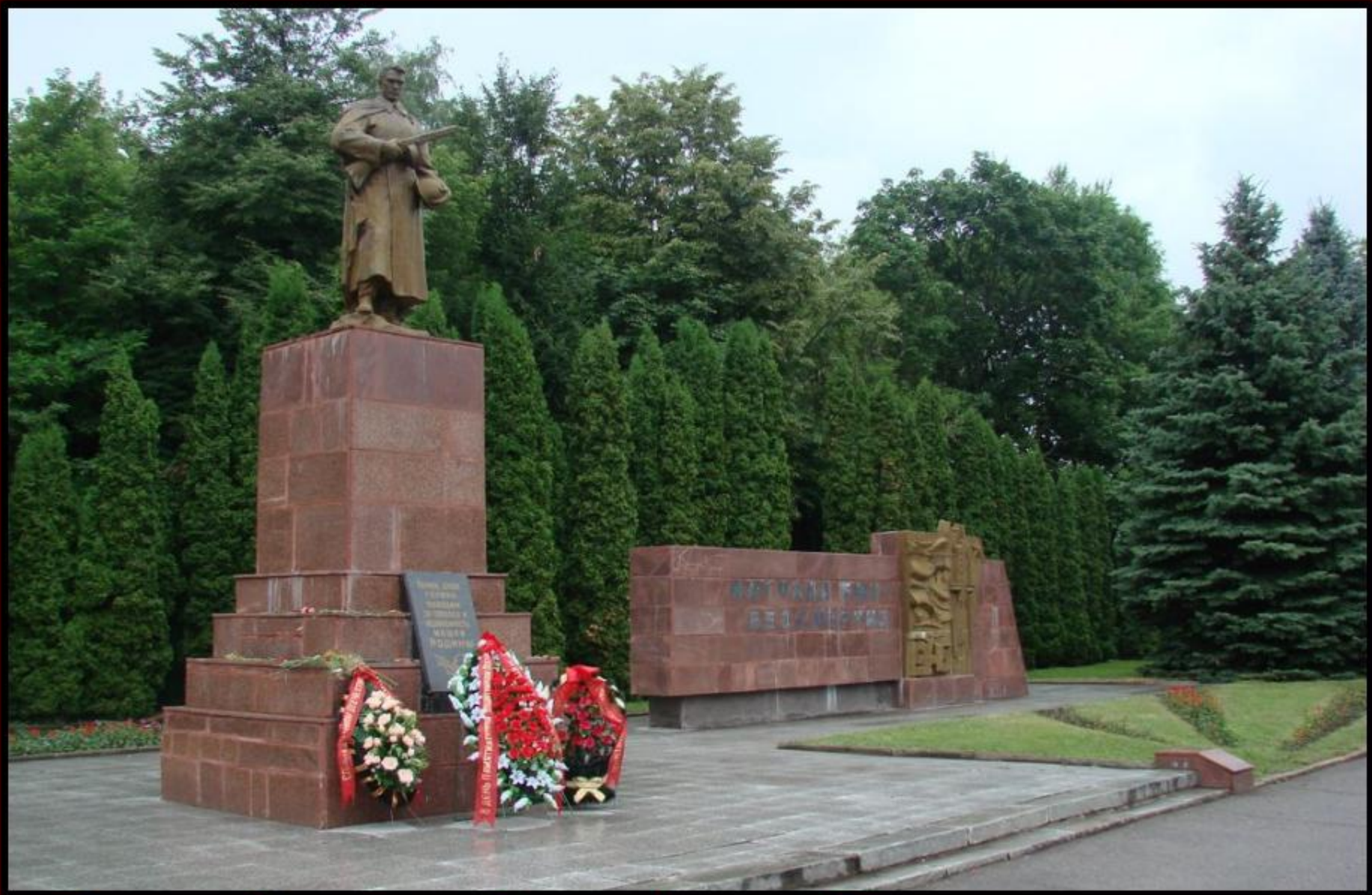
Памятник Неизвестному Солдату, Мемориал Победы