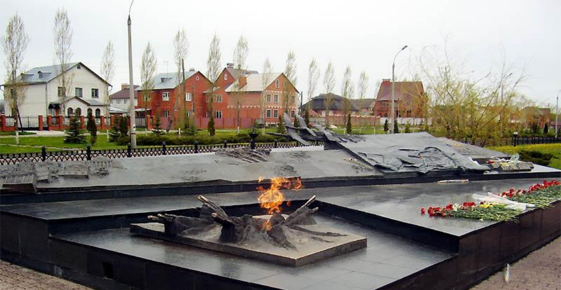
Триумфальная Арка г.Курск, памятник Неизвестному солдату