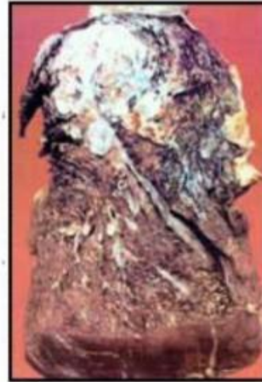
Больная ткань легкого