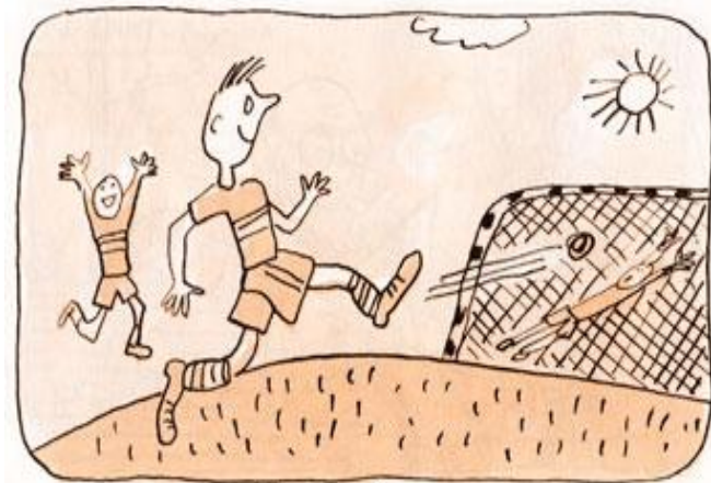
Игроки забили мяч,