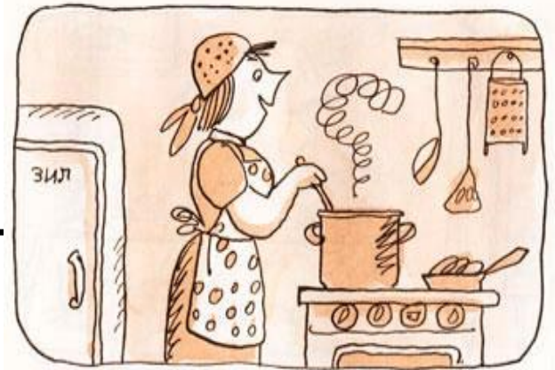
Тётя Маша суп варила

«Тётя Маша суп варила, Старичок читал газету, Васька-кот стащил котлет Игроки забили мяч, Зуб лечил больному врач Дядя Гога взял рассказ, Прочитал 15 раз, Сел и тут же без заминки Сразу сделал все картинки.