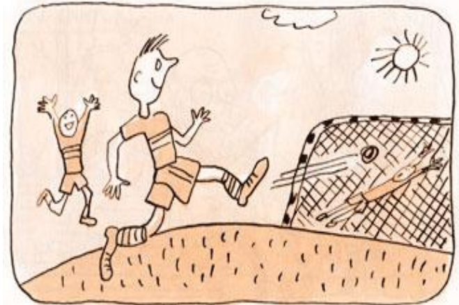
Игроки забили мяч,