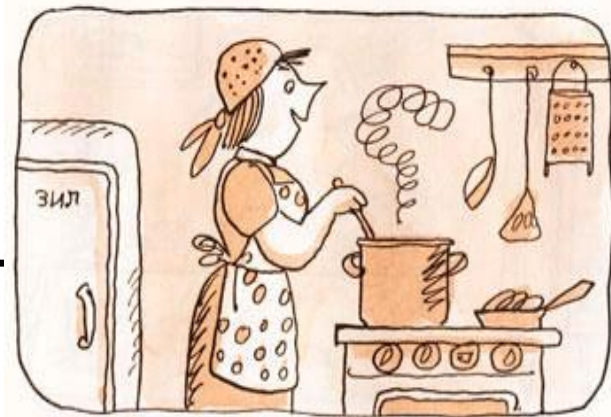
Тётя Маша суп варила

«Тётя Маша суп варила, Старичок читал газету, Васька-кот стащил котлет Игроки забили мяч, Зуб лечил больному врач Дядя Гога взял рассказ, Прочитал 15 раз, Сел и тут же без заминки Сразу сделал все картинки.