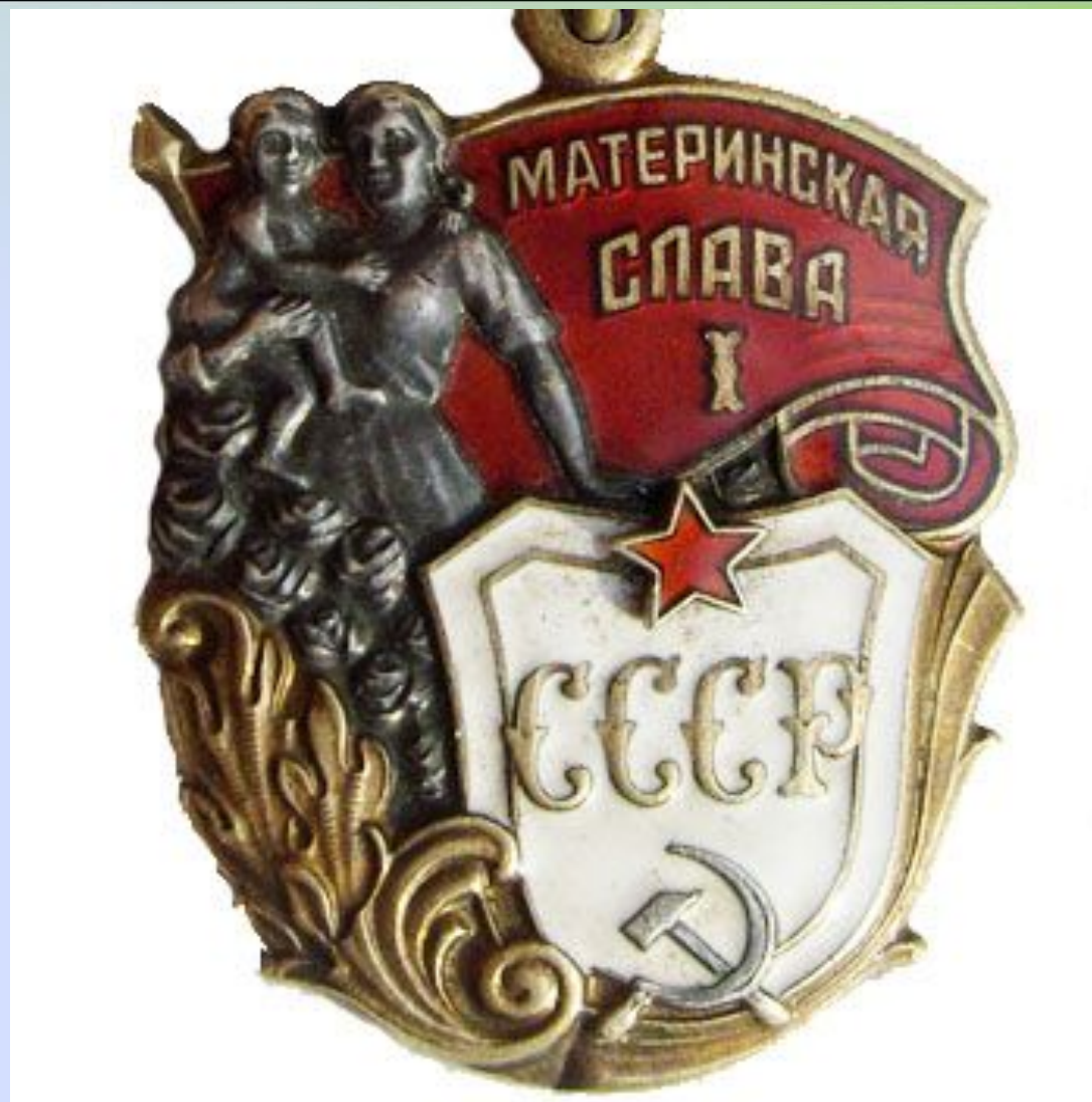
ОРДЕН МАТЕРИНСКОЙ СЛАВЫ