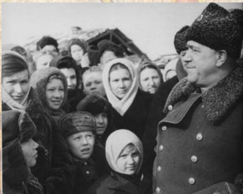
Деревня Галактионовка, Урал, 1950 г.