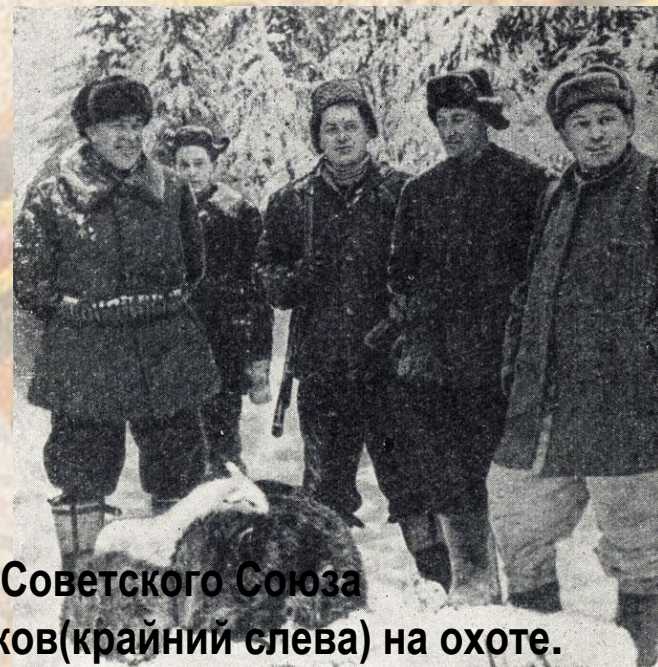
Маршал Советского Союза Г. К. Жуков(крайний слева) на охоте.