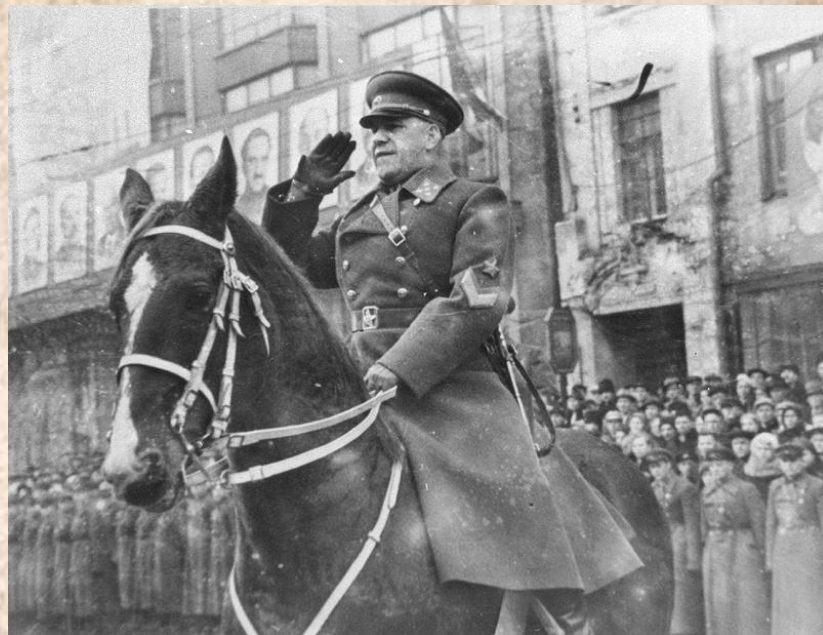
Маршал Жуков на параде победы в Свердловске 1 мая 1951 год