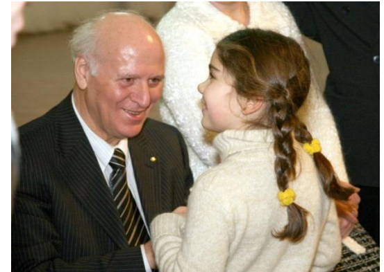
Ш. А. Амонашвили