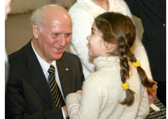
Ш. А. Амонашвили