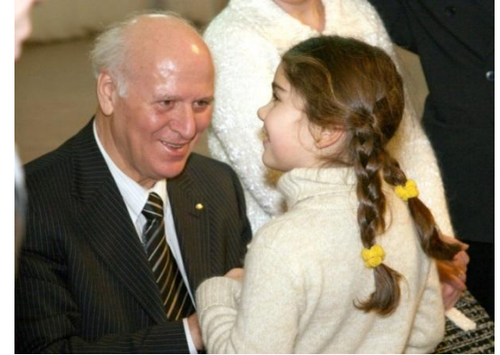
Ш. А. Амонашвили