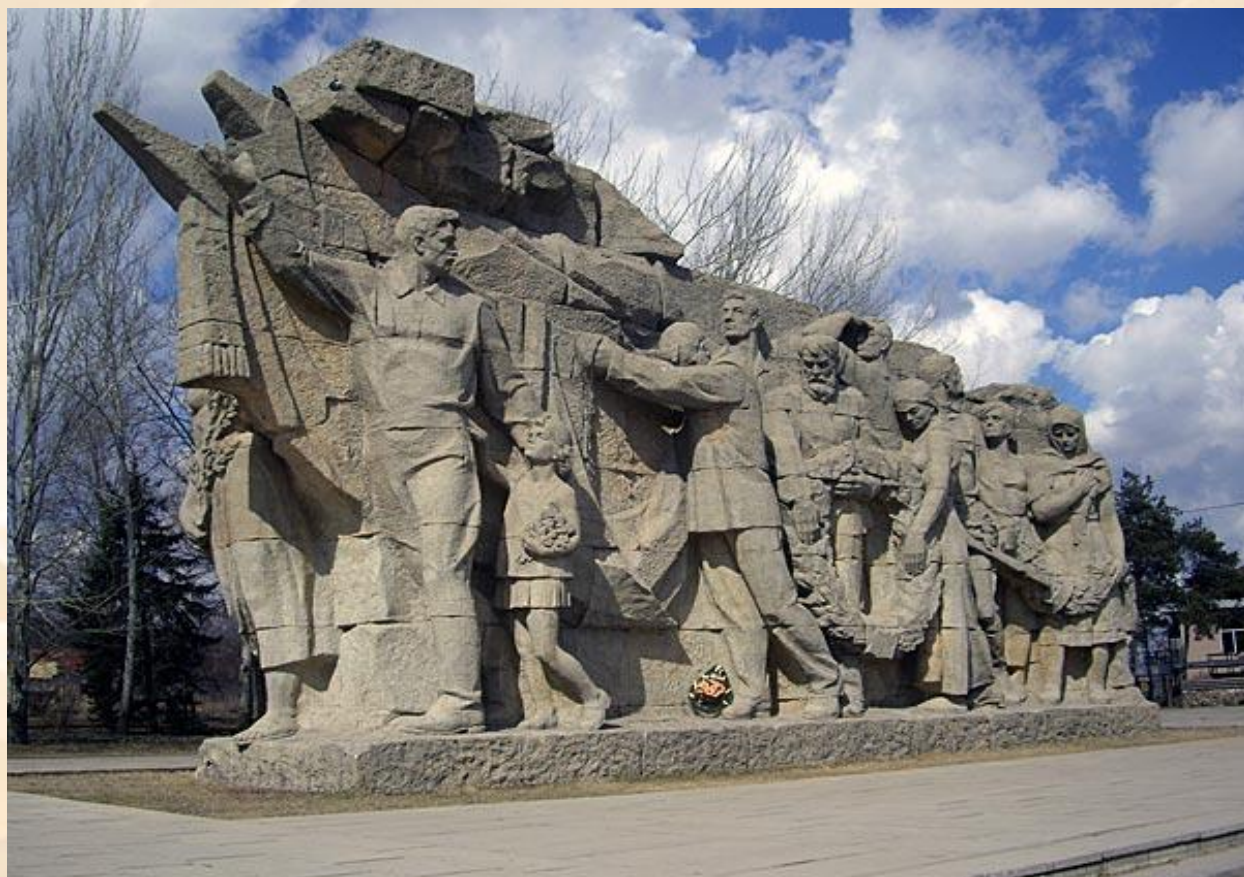
У входа на Мамаев курган. Скульптура «Память поколений».

Строили весь мемориал 8 лет – с 1959 по 1967гг.