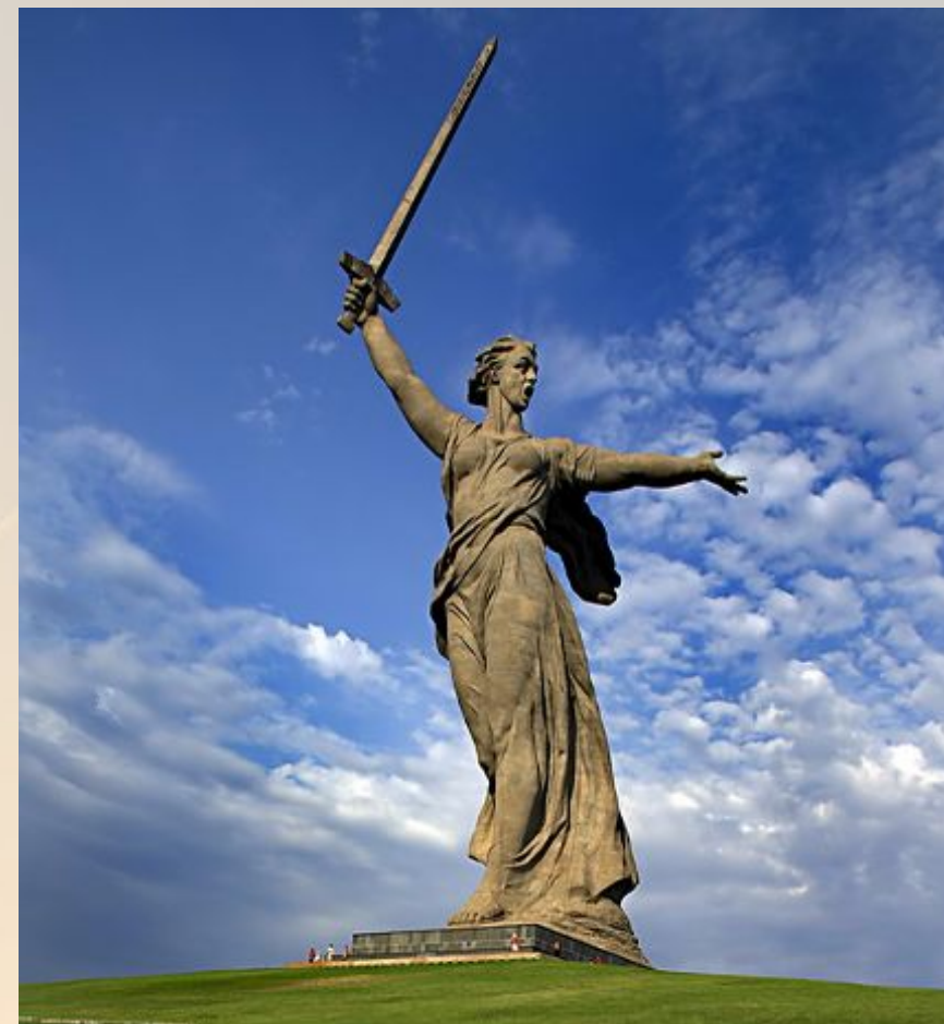
Скульптура «Родина-мать зовёт!»

Разгром немецко-фашистских войск под Сталинградом положил начало коренному перелому в Великой Отечественной войне.