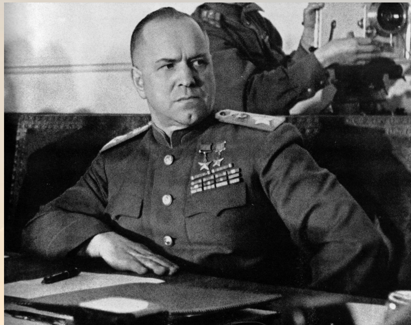
Маршал Г. К. Жуков.

13 ноября 1942 г. был рассмотрен и утвержден план контрнаступательной операции Красной Армии под кодовым названием «Уран», которая разрабатывалась под руководством маршала Г.К. Жукова. В течение двух месяцев под Сталинград в глубочайшей тайне перебрасывались огромные массы советских войск и техники.