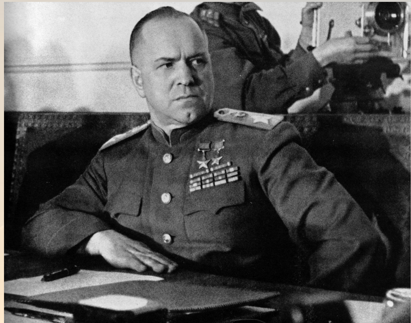
Маршал Г. К. Жуков.

13 ноября 1942 г. был рассмотрен и утвержден план контрнаступательной операции Красной Армии под кодовым названием «Уран», которая разрабатывалась под руководством маршала Г.К. Жукова. В течение двух месяцев под Сталинград в глубочайшей тайне перебрасывались огромные массы советских войск и техники.