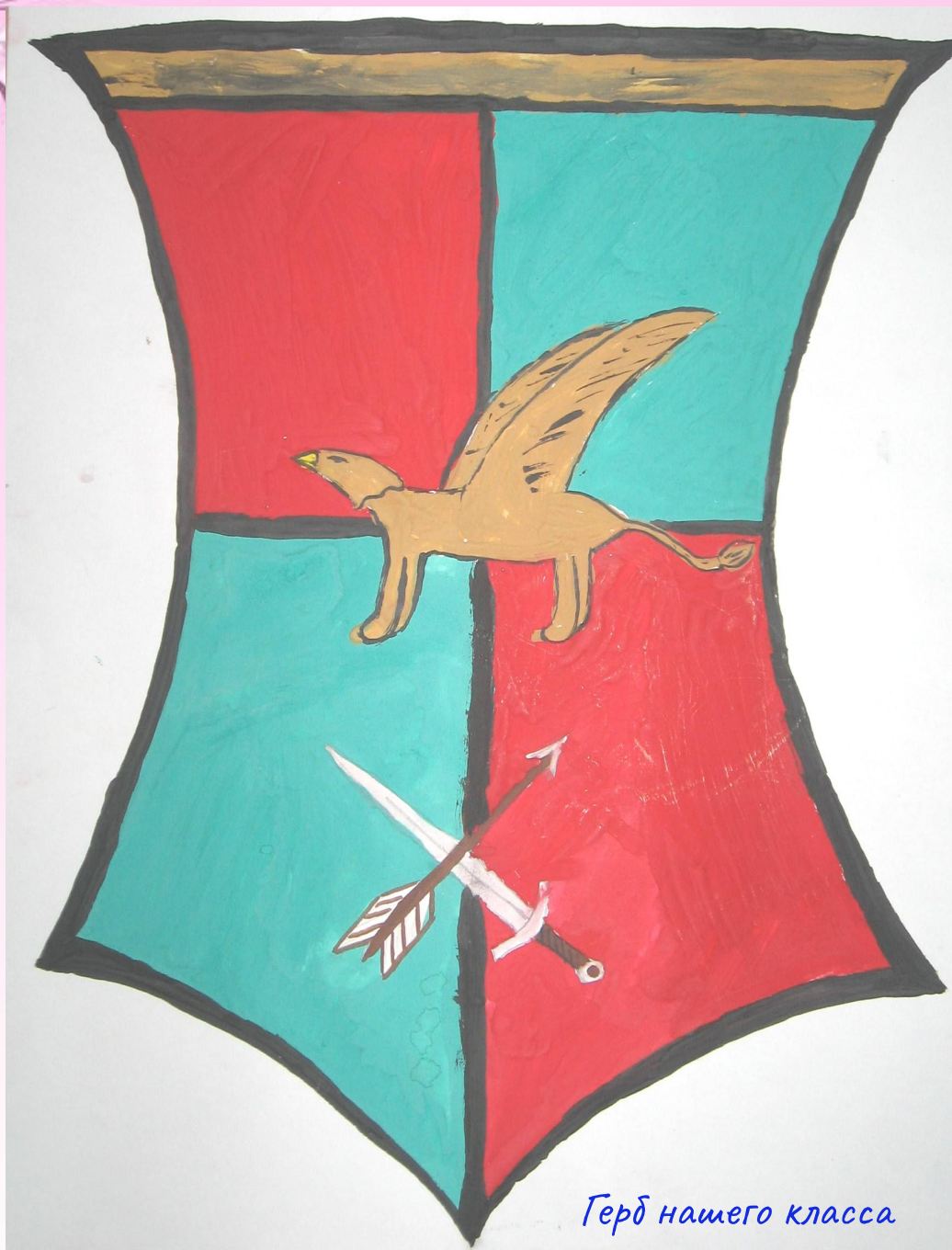
Герб нашего класса