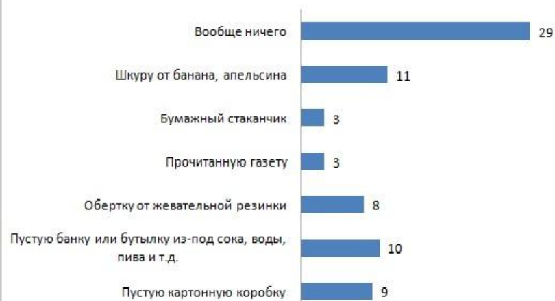
Что бы вы выбросили на улице?