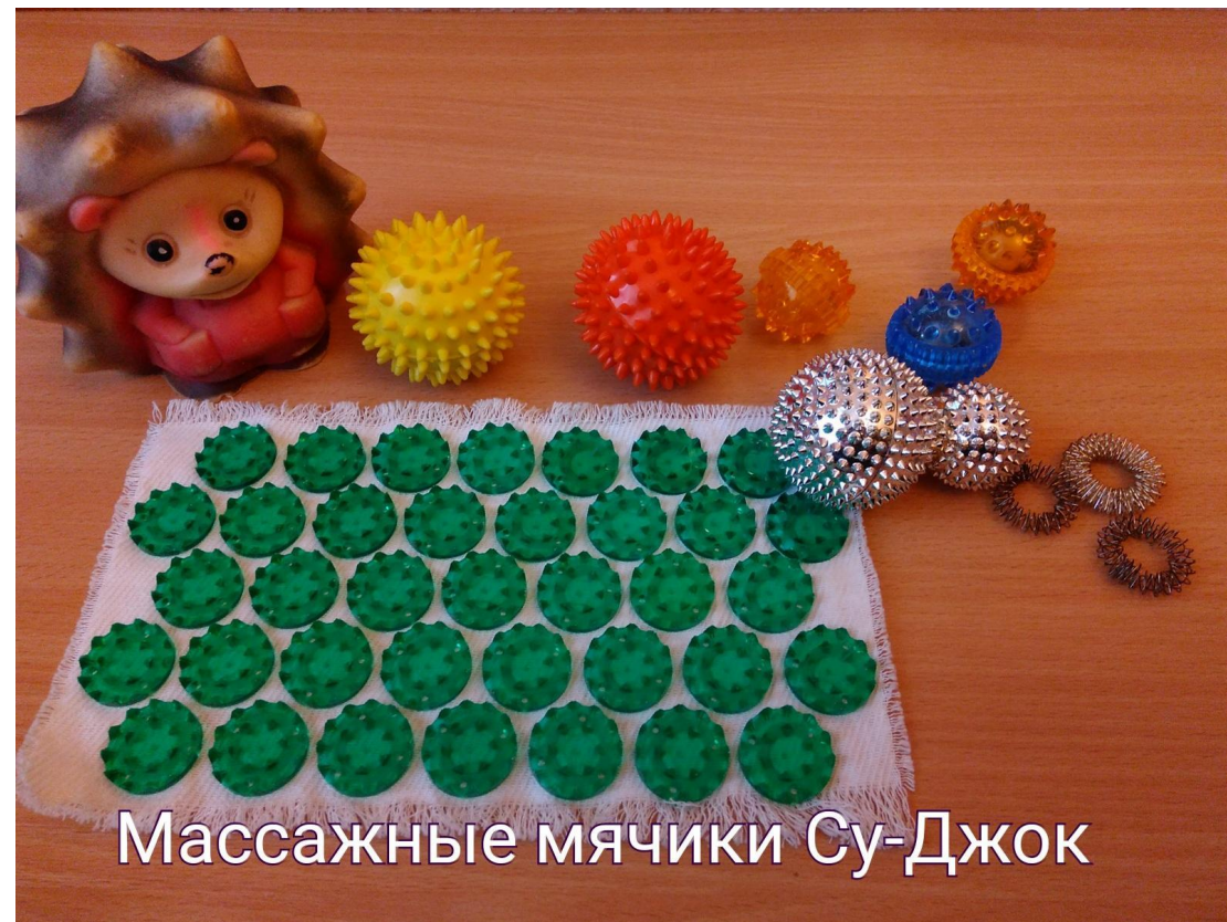
Массажные мячики Су-Джок