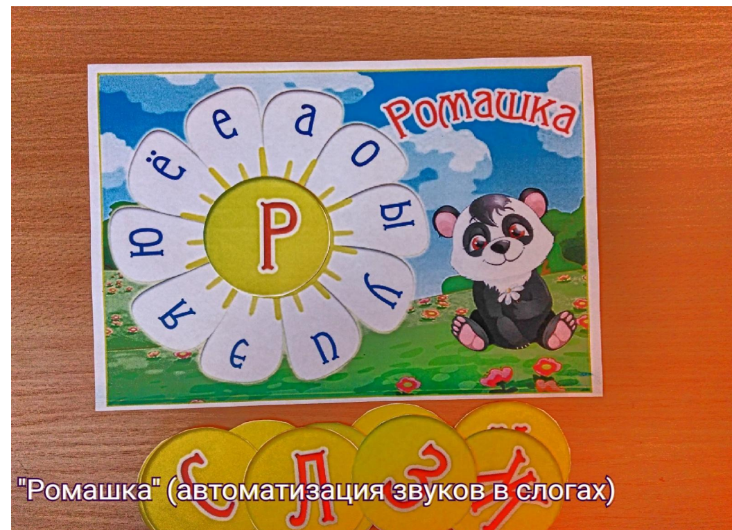
"Ромашка" (автоматизация звуков в слогах)