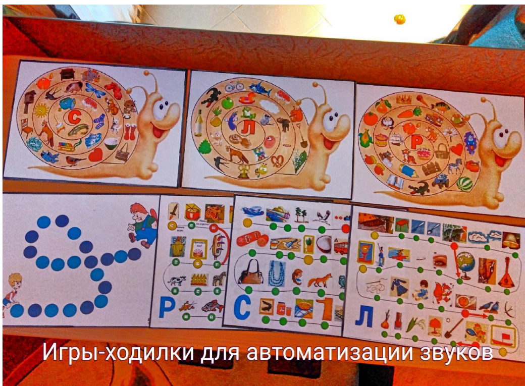
Игры-ходилки для автоматизации звуков

Дидактические игры, используемые в коррекции звукопроизношения, решают такие дидактические задачи, как подготовка артикуляционного аппарата к постановке нарушенного звука и закрепления правильного звукопроизношения.