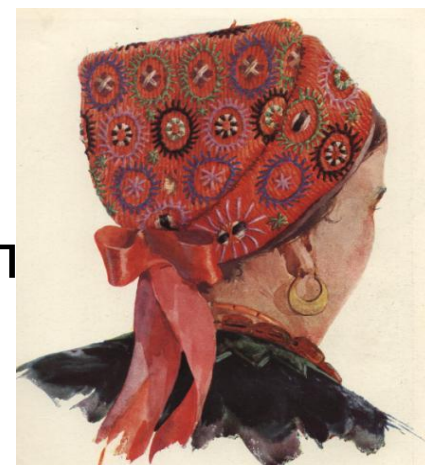
Женский очипок. Киевская область.

Упрощенный вариант головного убора украинских женщин - мягкая легкая шапочка (очипок, чепец, чеп) завязывалась шнурком, продернутым сквозь подшивку.