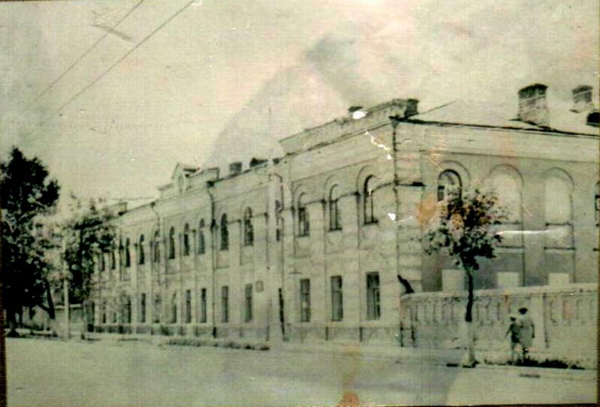
ЗДАНИЕ КАЗАХСКОЙ (КИРГИЗСКОЙ) ШКОЛЫ