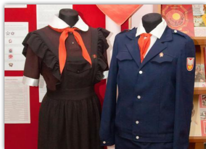
Советский период 1948 – 1992 гг.