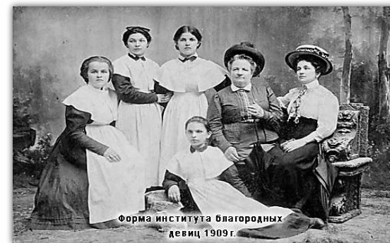
Школьная форма XIX века, начала XX века