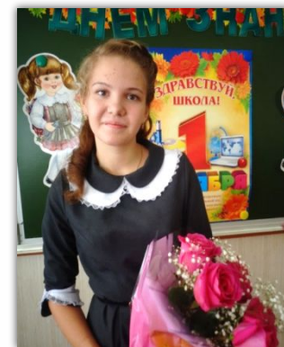
Возрождение... 2012-2017 гг.