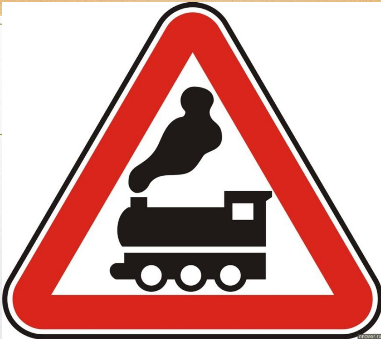
Железнодорожный переезд (без шлагбаума)