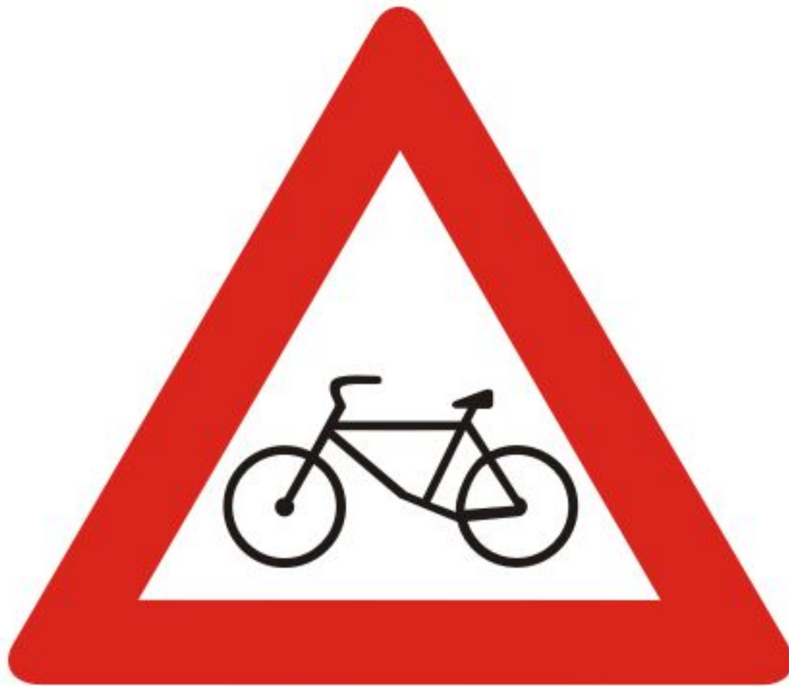
Пересечение с велосипедной дорожкой