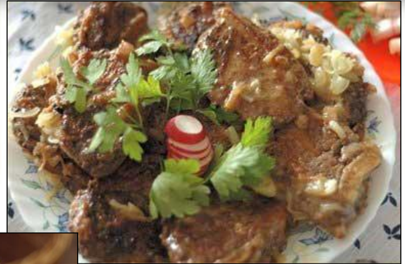
ОФТОНЬ МАДЯТ (МЕДВЕЖЬМ ЛАПКИ)