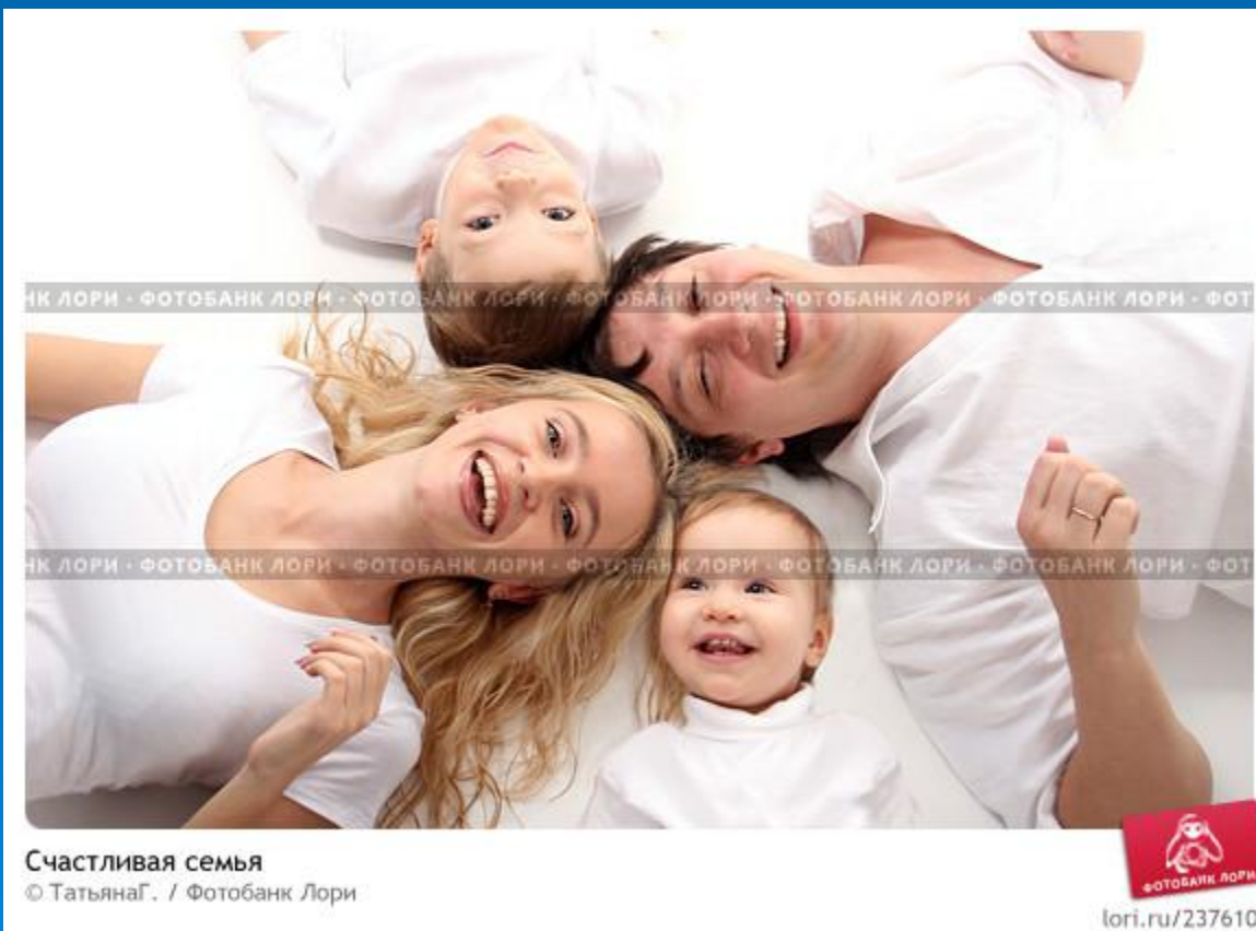
Счастливая семья