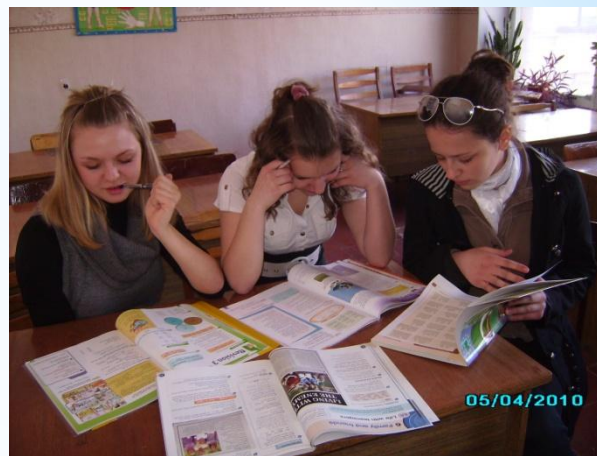
Работа над проектами