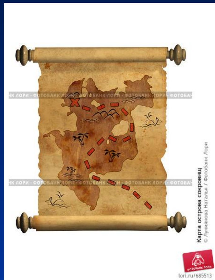
Карта острова сокровищ

Путь на карте покажи Вот, смотри- домой пришли!