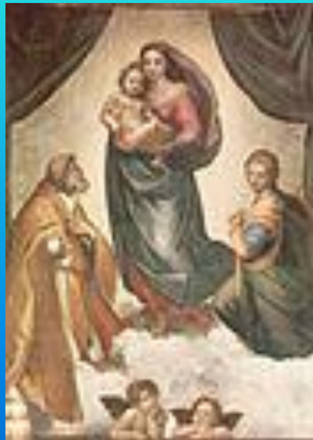
Рафаэль, Сикстинская Мадонна