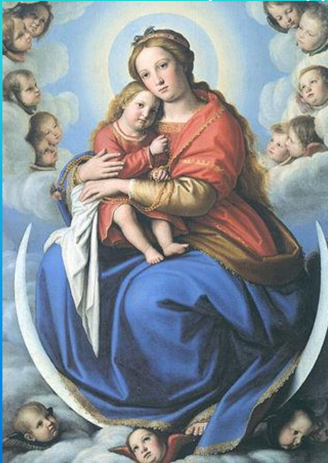
Мадонна с Иисусом (из собрания Ватиканского музея)

Матери, как наиболее значимой личности в жизни практически каждого человека, посвящено множество произведений искусства.