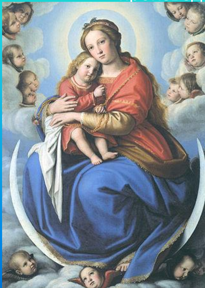
Мадонна с Иисусом (из собрания Ватиканского музея)

Матери, как наиболее значимой личности в жизни практически каждого человека, посвящено множество произведений искусства.