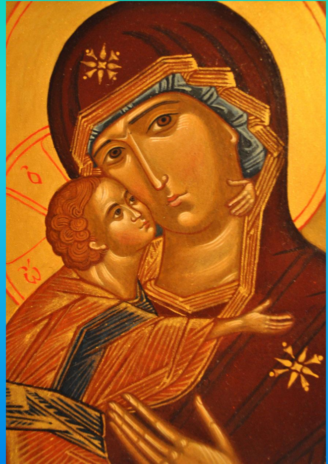
Владимирская икона Божией Матери