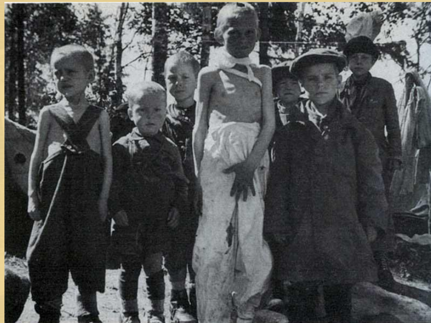
eine Gruppe russischer Buben, die auch wochenlang gehungert haben- Группа русских, голодавших неделями, мальчиков... ВН 49