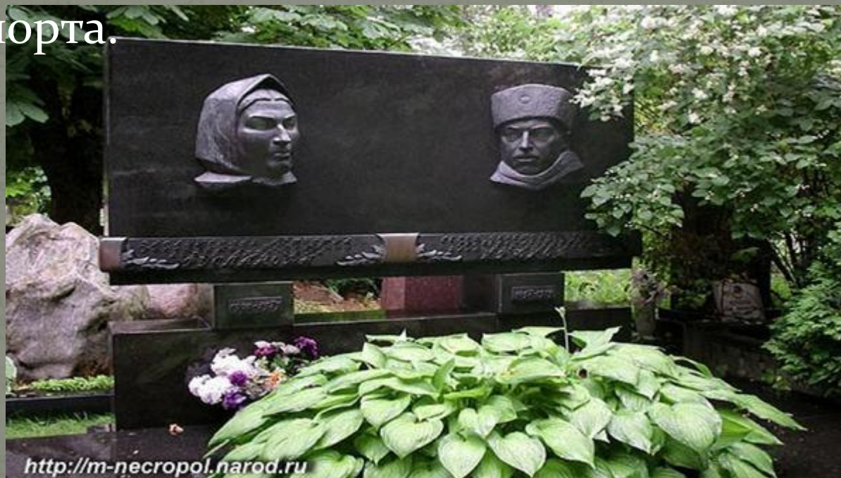
Новодевичье кладбище » Могила Лидии Руслановой и Владимира Крюкова