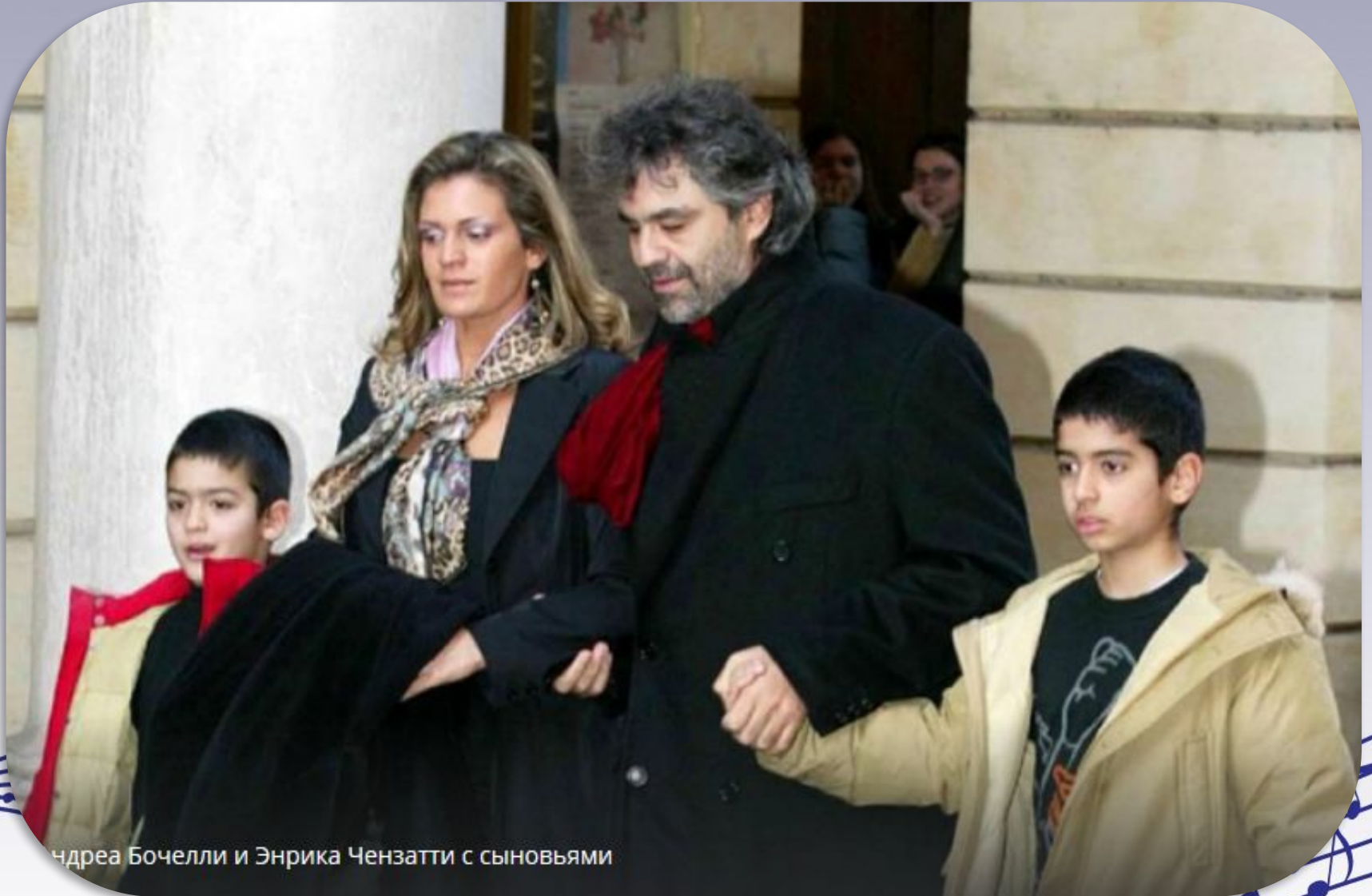
Андреа Бочелли и Энрика Чензатти с сыновьями