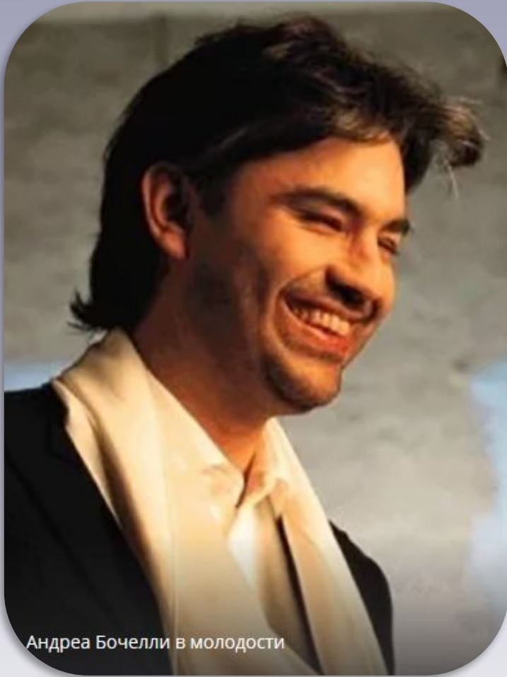
Андреа Бочелли в молодости

1992 год оказался переломным в биографии Андреа Бочелли: его запись песни «Мизерере» попадает великому тенору Лучано Паваротти , который поразился мастерству пения непрофессионала. С этого времени начинается восхождение Андреа Бочелли на Олимп славы.