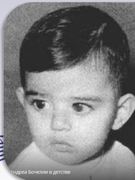
Андреа Бочелли в детстве

С детства у Андреа была диагностирована болезнь глаз. Его зрение стремительно падало, постоянно приходилось делать операции. Во время периодов реабилитации мальчика спасал проигрыватель с пластинками итальянских опер, которые он мог слушать часами. Незаметно для себя Андреа стал напевать знаменитые мелодии и выучивать их. Постепенно мальчик освоил игру на фортепиано, флейте и даже брал уроки игры на саксофоне.