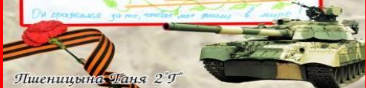
Пшеницына Тана 2Г