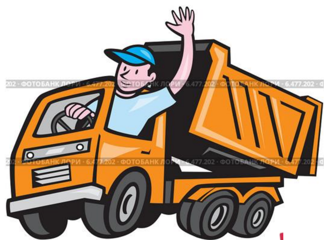
Водитель за рулём грузовика