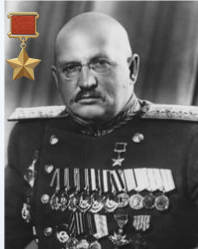
Командующий Северо-Кавказским фронтом генерал-полковник И.Е. Петров