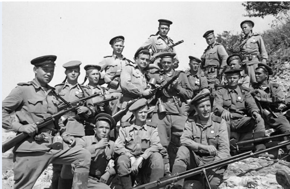
Морские пехотинцы из отряда майора Куникова перед высадкой на Малую землю