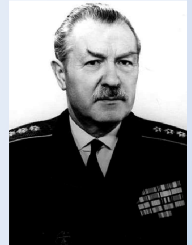
Командующий Черноморским флотом вице-адмирал Л.А. Владимирский