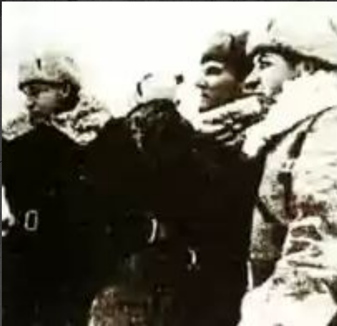
В центре полковник Ф.М.Черокманов на наблюдательном пункте 148-й стрелковой дивизии перед Ельцом

Город Елец освобождала 148-я стрелковая дивизия, которой командовал полковник Ф.М. Черокманов. 7 декабря она освободила восточную окраину города, поселок Ольшанец, кожевенный завод и Аргамаченскую слободу. 8 декабря вела уличные бои в центре г. Ельца, освобождая его квартал за кварталом. По свидетельству участников боев, Елец был окутан густыми облаками дыма, сотрясаясь от взрывов.