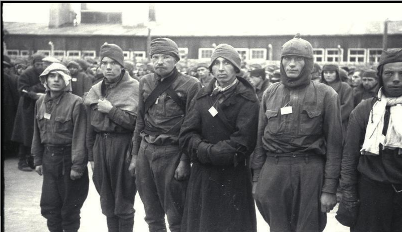
Bild 192-205 Oktober 1941