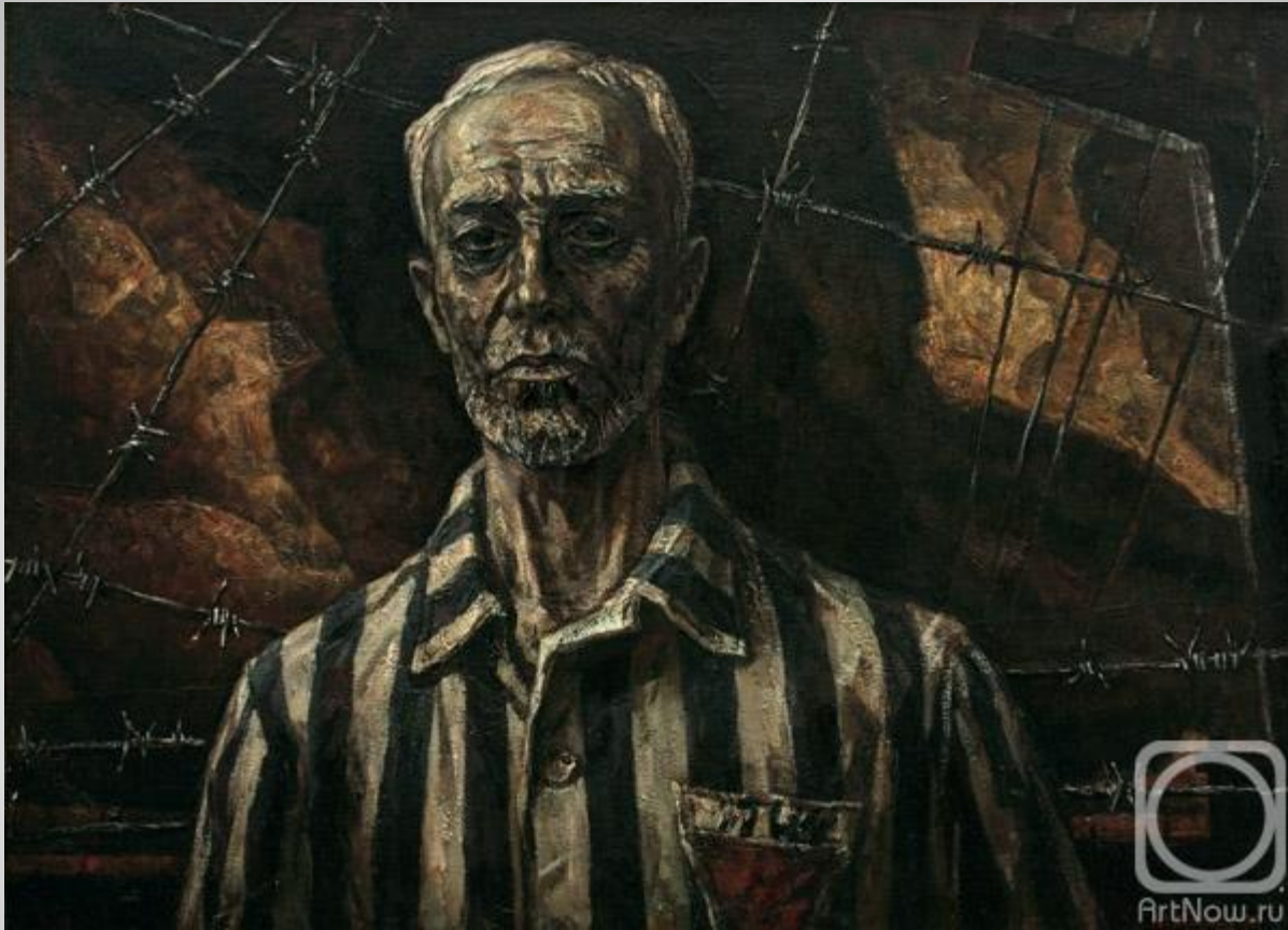
Дмитрий Михайлович Карбышев