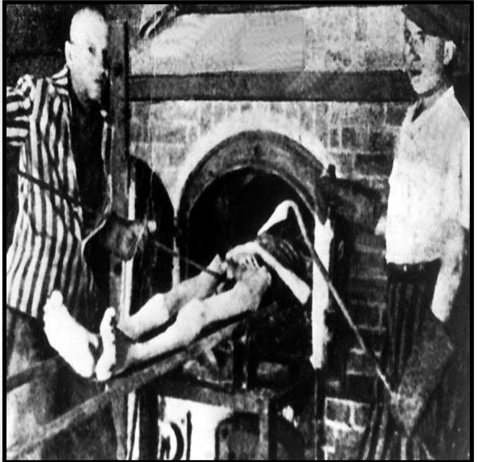
Печи крематория в Освенциме