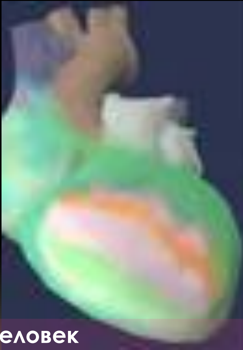
Человек который бросил