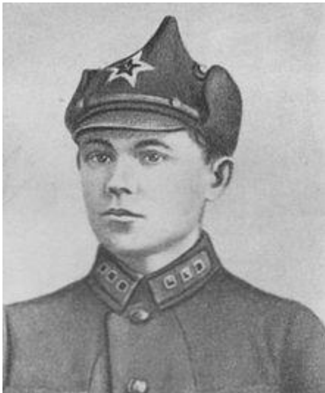
Комроты Н. Ф. Ватутин в 1926 году