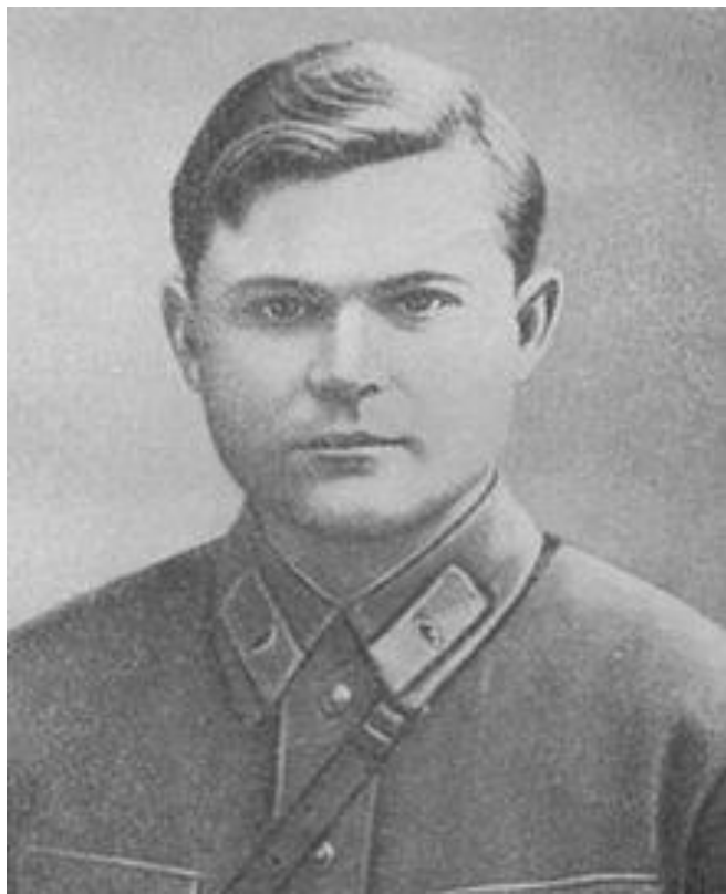
Комбриг Н. Ф. Ватутин в 1937 году