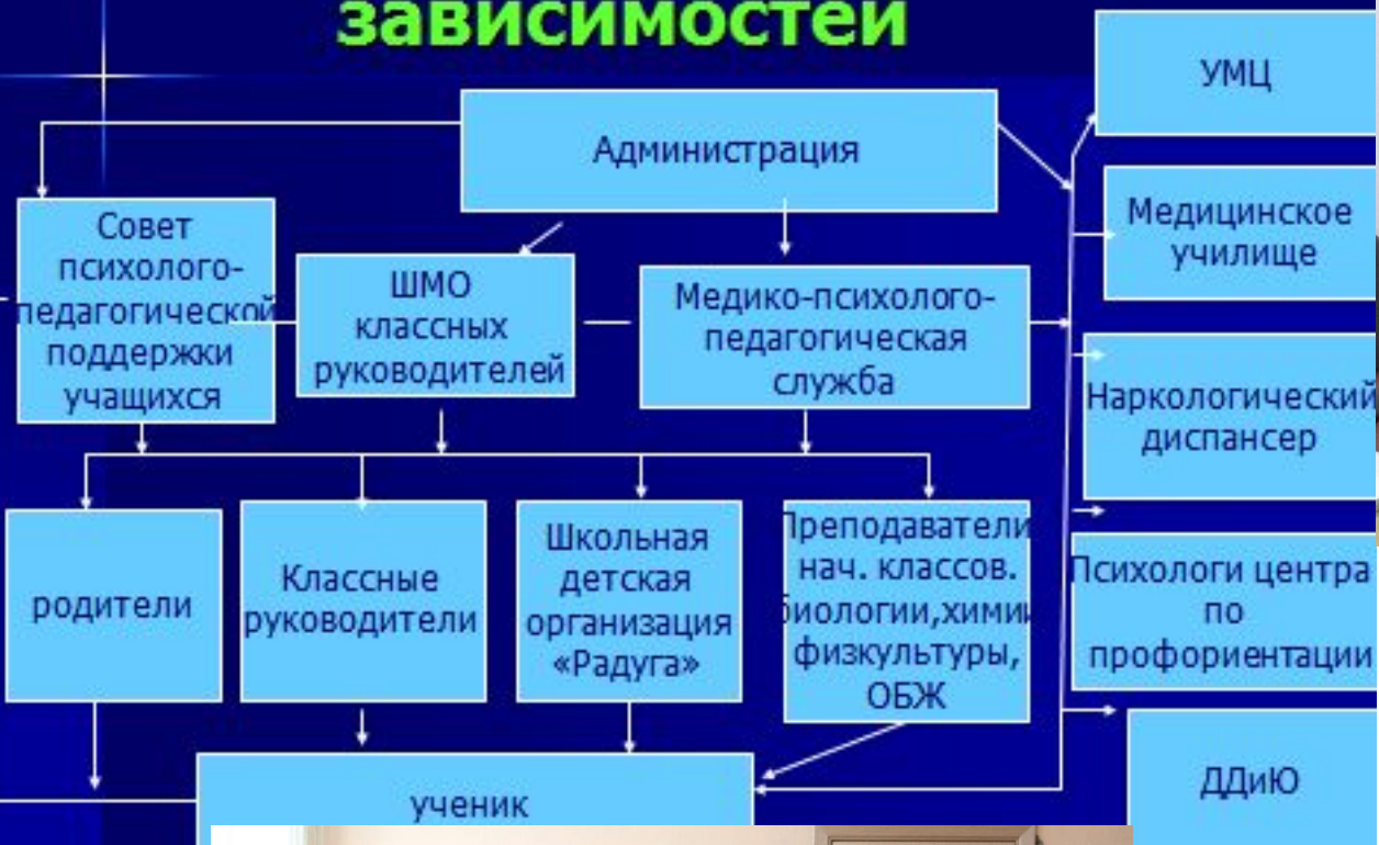
Схема работы школы № 3 по профилактике негативных зависимостей