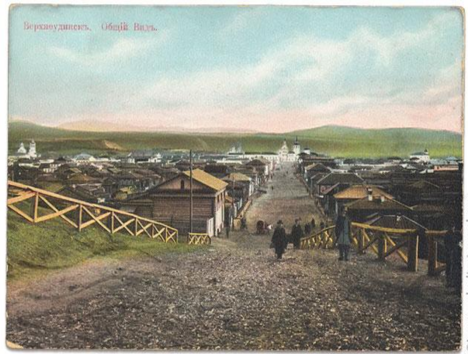
Верхнеудинскъ. Общій Видъ.