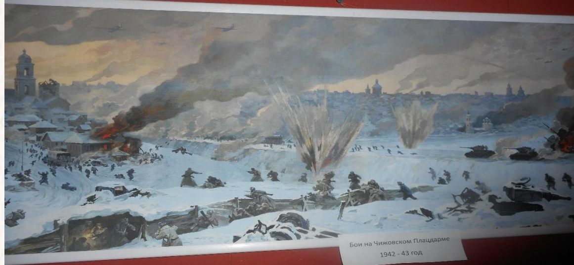
Бои на Чижовском Плацдарме 1942 - 43 год