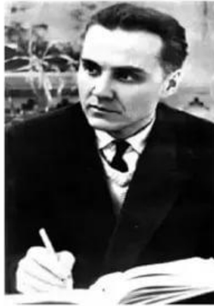
В. А. СУХОМЛИНСКИЙ