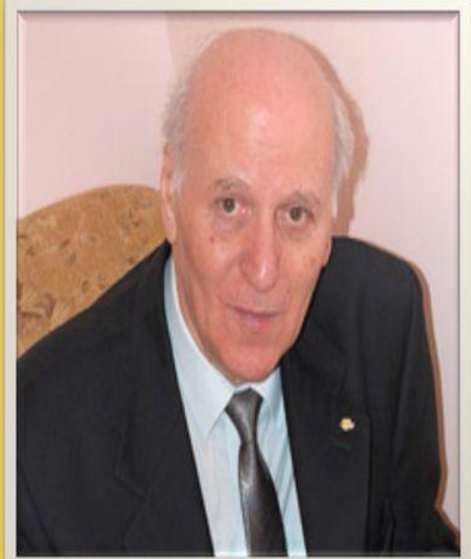
АМОНАШВИЛИ Шалва Александрович