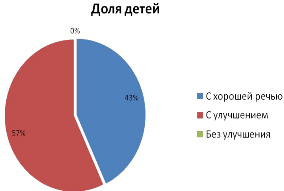
ДИАГРАММА РЕЗУЛЬТАТОВ ЛОГОПЕДИЧЕСКОЙ РАБОТЫ С ДЕТЬМИ СТАРШЕЙ ГРУППЫ

Таким образом: доля детей с улучшением речи составляет 100%