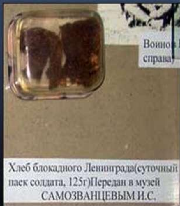
Хлеб блокадного Ленинграда(суточный паек солдата, 125г)Передан в музей САМОЗВАНЦЕВЫМ И.С.