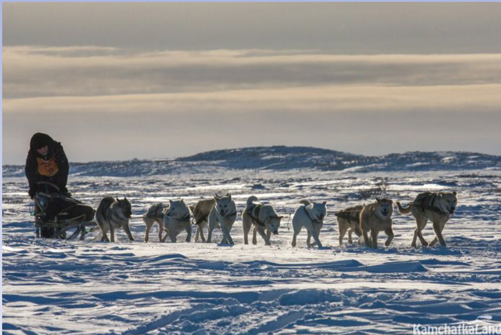
Фото с Беренгии.