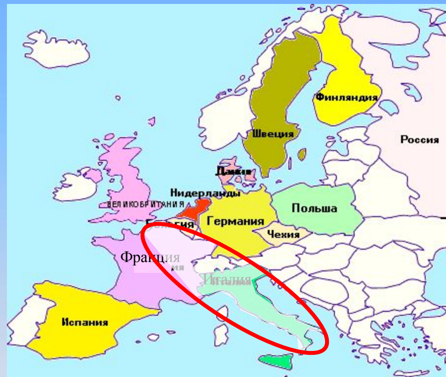
Рис.2. Формирование фамилий в Италии и на юге Франции (XI век)