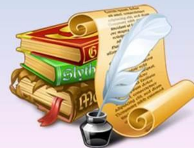
Рис.3. Формирование фамилий в Англии, Франции, Италии, Германии, Дании (XV век)