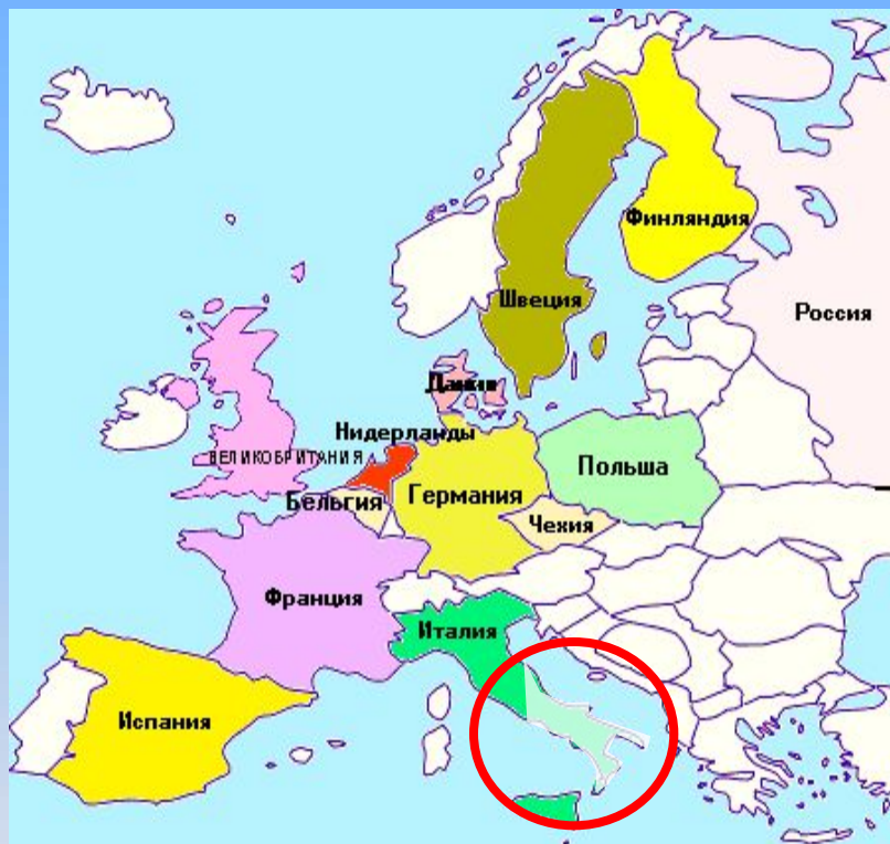
Рис.1. Начало формирования фамилий на севере Италии (X век)